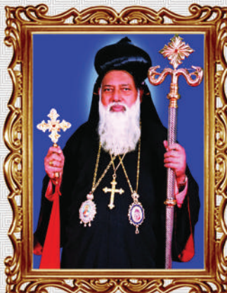
Major Archbishop Cyril Mar Baselios Catholicos