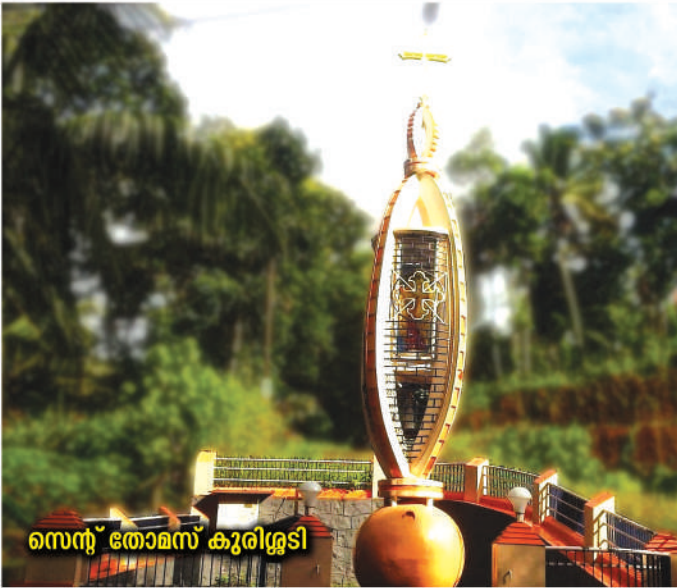
സെന്റ് തോമസ് കുരിശ്ശി