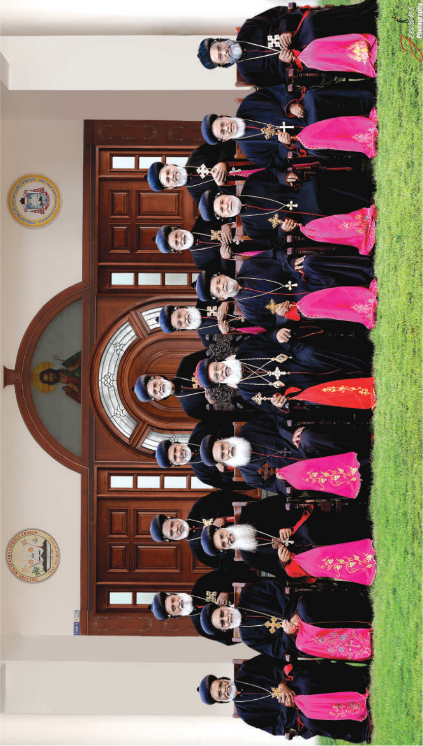
THE MAJOR ARCHBISHOP-CATHOLICOS AND BISHOPS OF THE MALANKARA SYRIAC CATHOLIC CHURCH DURING THE HOLY EPISCOPAL SYNOD ON 20-02-2024