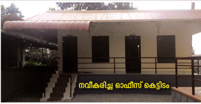
നവീകരിച്ച റെഫീസ് കെട്ടിടം