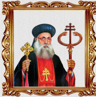
Servant of God Archbishop Geevarghese Mar Ivanios