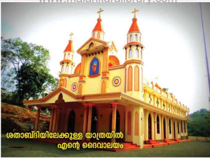
ശതാബ്ദിയിലേക്കുള്ള യാത്രയിൽ എന്റെ ദൈവാലയം