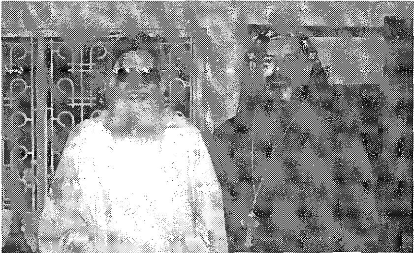
അഭിവന്ദ്യ ജോഷ്യാ മാർ ഇസ്രായീൽ യോസഫ് മെത്രാപ്പോലീത്തായും ഗ്രന്ഥകർത്താവും.