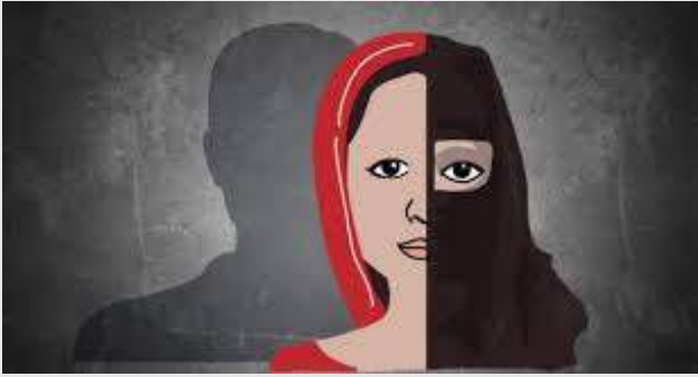
പ്രകടമാക്കുക എന്നുള്ളത് സഭാ നേതൃത്വത്തിന്റെ കടമയാണ്.

സഭാമക്കളായ പെൺകുട്ടികൾക്കിടയിൽ ഒരുവിഭാഗം സാമാന്യ രീതികൾക്കപ്പുറമുള്ള ചില ബന്ധങ്ങളിൽപ്പെട്ട പുറത്തുപോവുകയും, നിർബന്ധിത മതപരിവർത്തനത്തിന് വിധേയരാവുകയും, ചിലർ ഐഎസിന്റെയും മറ്റും ഇരകളായി മാറുകയും ചെയ്യുന്നു. ഭീകരപ്രവർത്തനത്തിൽ ഏർപ്പെട്ടതിനു ശേഷം തിരികെയെത്തിയ ചില പെൺകുട്ടികളിൽ ക്രൈസ്തവരും ഹൈന്ദവരും ഉണ്ട്. ആ ഒരു പ്രതിസന്ധി നിലനില്ക്കുമ്പോൾ അതിലുള്ള ആശങ്ക