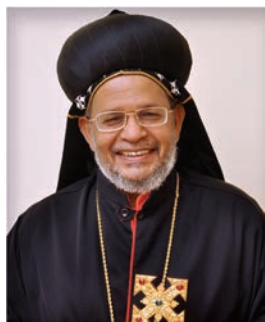
ഡോ. ജോസഫ് മാർ തോമസ് മെത്രാപ്പോലീത്താ

ഏതൊരു ജനതയുടെയും ആത്മീയ സംസ്കാരത്തിന്റെ ഭാഗമാണ് മതം. ഒരു രാജ്യത്തിന്റെ രാഷ്ട്ര മീമാംസ, സാഹിത്യം, കല, തത്വചിന്ത, ധർമ്മികത, ആലയ നിർമ്മാണം, ആചാരങ്ങൾ എന്നിവയുടെ മേൽ മതം വലിയൊരളവിൽ സ്വാധീനം ചെലുത്തുന്നുണ്ട്. അതുകൊണ്ട് മതത്തെ അവഗണിക്കാനോ തകർക്കാനോ ആർക്കും സാധ്യമല്ല. ഇതിന് ഉത്തമ ഉദാഹരണങ്ങൾ ചരിത്രത്തിൽ ധാരാളമുണ്ട്. ഗുജറാത്തിലെ സോമനാഥ ക്ഷേത്രം 16-ൽ പരം പ്രാവശ്യം വൈദേശിക ആക്രമണത്തിന് ഇരയായിട്ടുണ്ട്. പക്ഷേ ഒരു ഹിന്ദുവിന്റെ പോലും മതവിശ്വാസം മാറ്റുവാൻ ഈ ആക്രമണങ്ങൾക്ക് കഴിഞ്ഞിട്ടില്ല. ബാബറി മസ്ജിദ് തകർക്കപ്പെട്ടതിനു മുൻപ് ഉള്ളതിനേക്കാൾ ശക്തവും സംഘടിതവുമാണ് മുസ്ലീം സഹോദരങ്ങൾ. അതുകൊണ്ട് മതങ്ങളോട് നാം നിഷേധാത്മകമായ നിലപാട് പുലർത്തരുത്. മറിച്ച് അവയെ പരസ്പരം ബഹുമാനിക്കാനും ആദരിക്കാനും നാം തയ്യാറാകണം. എങ്കിൽ മാത്രമേ നമ്മുടെ നാട് പുരോഗമിക്കുകയുള്ളൂ. സമാധാനവും സംതുപ്തിയും നിറഞ്ഞ ജീവിതം നമുക്ക് ലഭ്യമാകുകയുള്ളൂ.