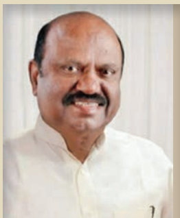
ഡോ. സി.വി. ആനന്ദ ബോസ് ഐ.എ.എസ് ഫോർമർ സെക്രട്ടറി ടു ഗവ. ഓഫ് ഇന്ത്യ

ഗാ സിജി പറഞ്ഞു മതവും രാഷ്ട്രീയവും തമ്മിൽ ബന്ധമില്ലെന്ന് കരുതുന്നവർക്ക് രണ്ടിനെയും കുറിച്ചും ധാരണയില്ല. മനുഷ്യ മനസ്സിന്റെ ആത്മീയ തലങ്ങൾ സംശുദ്ധമാക്കി ഈശ്വരനിലേയ്ക്ക് നയിക്കുന്ന ശക്തമായ മാധ്യമം ആണല്ലോ മതം. മനുഷ്യന്റെ ഭൗതികമായ കാര്യങ്ങൾ ശ്രദ്ധിക്കുന്ന ഒരു വിഷയമാണല്ലോ രാഷ്ട്രീയം. രണ്ടും തമ്മിൽ ഒരു വൈരുദ്ധ്യത്തകത തോന്നാം. ഇത് ഉപരിപ്ലവമായി നോക്കുമ്പോൾ കാണുന്ന ഒരു പ്രതിഭാസം ആണ്. ആന്തരികമായ മനുഷ്യന്റെ എല്ലാ മനോവ്യാപാരങ്ങളും ഈശ്വര ചൈതന്യത്തിന്റെ പ്രതിഫലനം തന്നെ ആണ്. അപ്പോൾ സൈദ്ധാന്തികമായി മതവും രാഷ്ട്രീയവും രണ്ടല്ല. പരസ്പരം പൂരിതമാണ്. മതത്തിൽ അധിഷ്ഠിതമായ രാഷ്ട്രങ്ങൾ ചരിത്രത്തിൽ അന്യമല്ല. തിയോക്രറ്റിക് സ്റ്റേറ്റ്സ്. മതത്തെ പൂർണ്ണമായും അകറ്റി നിർത്തിയ ഭരണാധികാരികളും കുറവല്ല. മതം മനുഷ്യനെ മയക്കുന്ന കറുപ്പാണ് എന്ന മാർക്സിസ്റ്റിൻ തത്വശാസ്ത്രം മതത്തെ രാഷ്ട്ര ഭരണത്തിൽ നിന്ന് പൂർണ്ണമായും ഒഴിച്ച് നിർത്താൻ ശ്രമിച്ചു .