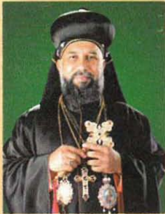
മോറൻ മോർ ബസേലിയോസ് ക്ലീമീസ് കാതോലിക്കാ ബാവ

മോറൻ മോർ ബസേലിയോസ് ക്ലീമീസ് കാതോലിക്കാ ബാവായുടെ സുവിശേഷ പ്രഭാഷണങ്ങൾ