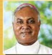
ആർച്ച്ബിഷപ്പ് ഡോ. തോമസ് നെറ്റോ (തിരുവനന്തപുരം അതിരൂപത)