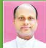
മാർ പീറ്റർ കൊച്ചുപുരയിൽ