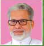
മാർ ജോസഫ് കല്ലറങ്ങാട്ട്