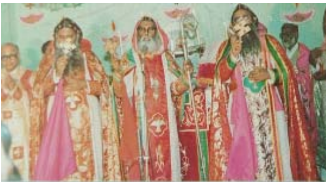
അന്റെ മെത്രാപ്പോലീത്ത കന്യാ മൂപ്പന്മാരിൽനിന്നും അദ്ദേഹത്തിന് മറ്റ് മെത്രാപ്പോലീത്തന്മാർ, മറ്റ് മൂപ്പന്മാർ എന്നീ മെത്രാപ്പോലീത്തന്മാർ.

അഭിവന്ദ്യ പിതാവിന്റെ ജീവിതത്തിൽ പ്രകടമായി വിളങ്ങിയ ദൈവസ്നേഹവും മനുഷ്യസ്നേഹവും സഭാസ്നേഹവും ലാളിത്യവും വിനയവും അദ്ദേഹത്തെ അനുസ്മരിക്കുന്ന ഈ വേളയിൽ നമ്മുടെ ജീവിതത്തിലും അനുകരിക്കാം.