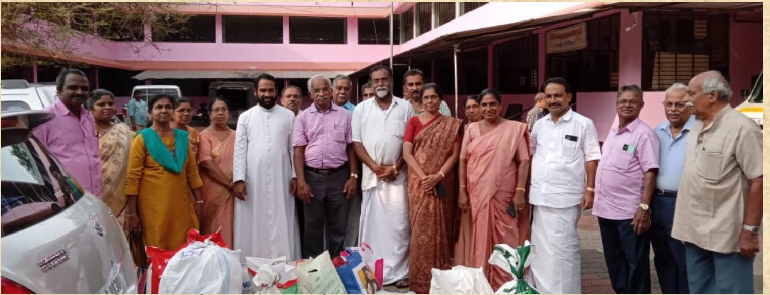
എം സി എ റാനി മേഖല യൂണിറ്റുകളുടെ സഹകരണത്തോടെ ശാലോം കാരുണ്യഭവൻ സന്ദർശിച്ചു