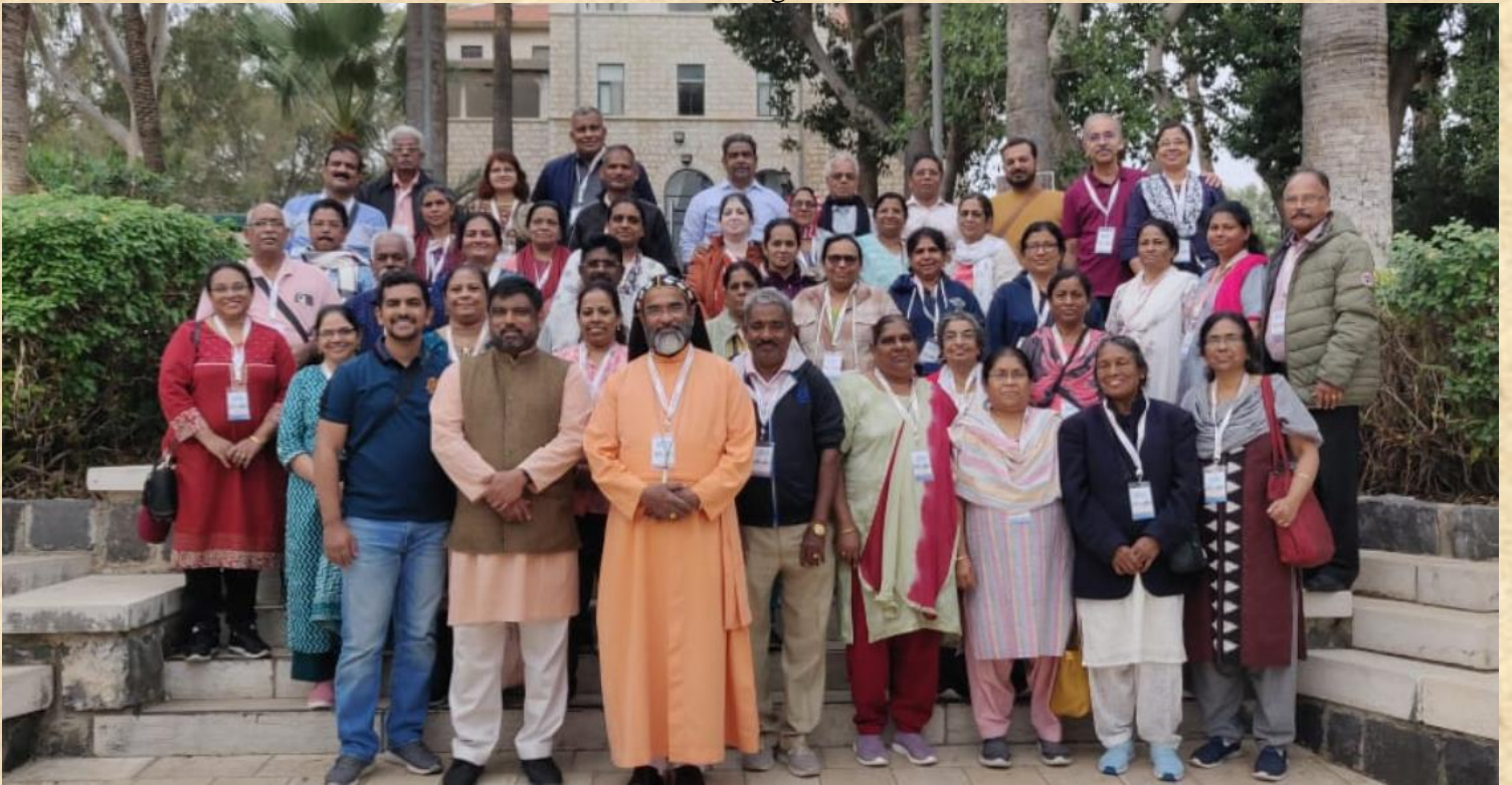
Members of Pune-Khadki