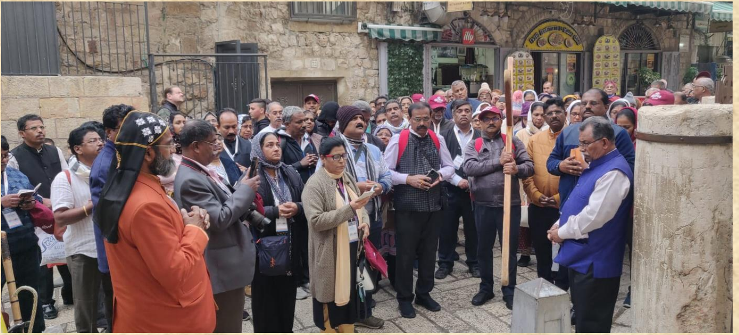
Way of Cross @ Gogulta