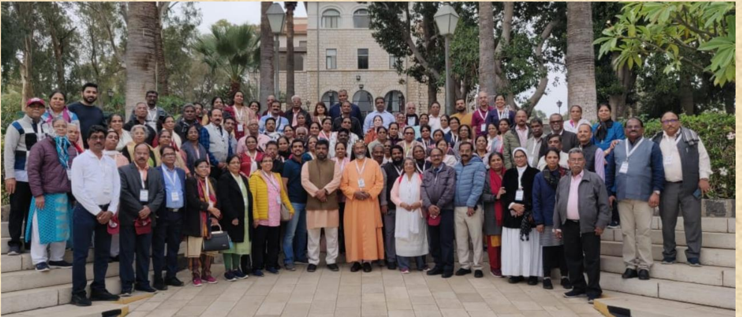
Entire Team of 92 members