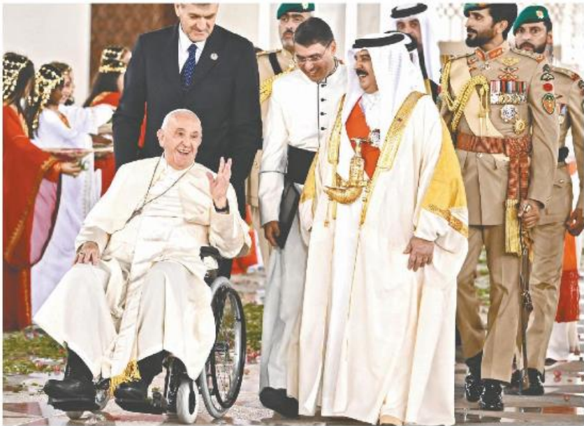
ബഹ്റിൻ നാലു ദിവസത്തെ അഭിനന്ദനാലേക സന്ദർശനത്തിനുശേഷം പ്രാർത്ഥനാ മാർപാപ്പ സാബിർ കൊട്ടാരത്തിൽ ഹാജർ ബിൻ ഉസ്ത അൽ വലിദ് രാജാജോയി കൂടിക്കാഴ്ച നടത്തിയശേഷം പുറത്തേക്കു വരുന്നു.