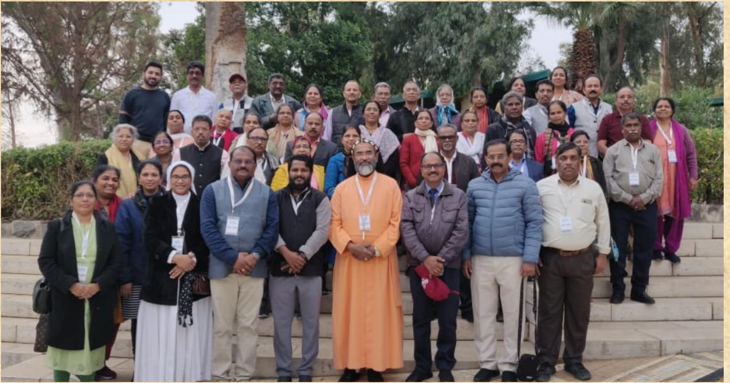
Members of Gurgaon Diocese