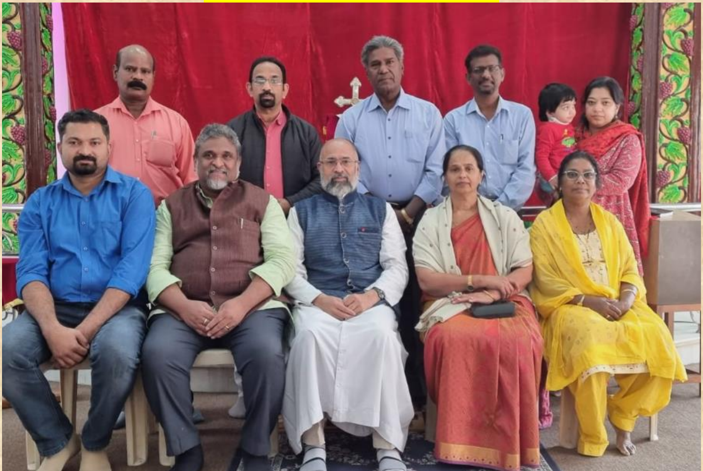
Newly elected MCA Jasola Unit Members