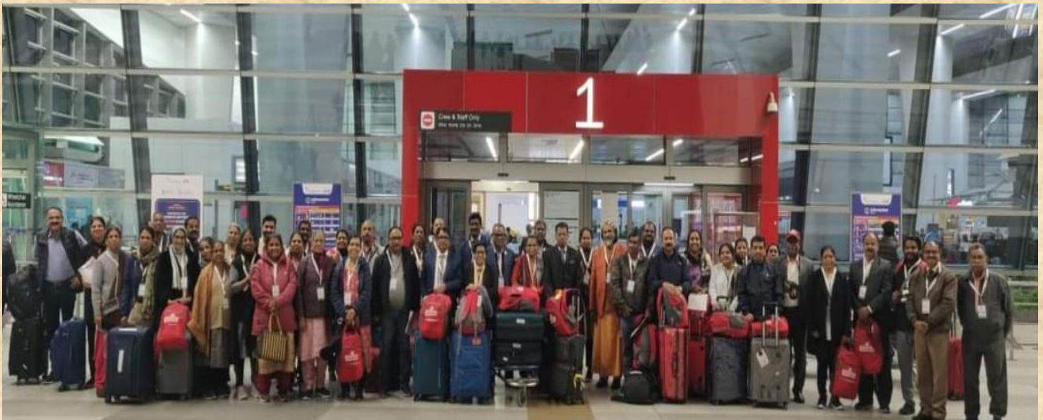
Departure from Delhi Airport