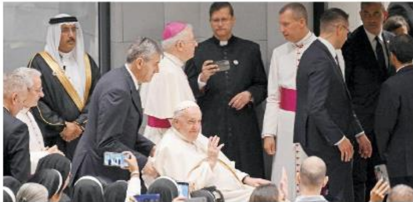
പോപ്പ് ഫ്രാൻസിസ് അറബ്ബി കമ്മ്യൂണിറ്റിയിൽ എക്സക്യൂട്ടീവ് സമ്മേളനത്തിലും സമാപന പ്രാർഥനയിലും പങ്കെടുക്കാൻ മാർപാപ്പ എത്തിയപ്പോൾ.

മതം: സ്വകാര്യ താല്പര്യങ്ങളും യുദ്ധവും മുന്നിട്ടു നിൽക്കുന്ന ലോകത്തിൽ മതനേതാക്കൾ ഉത്തമമാതൃക നൽകുന്നവരും മൂറിവെറ്റ മനുഷ്യ മഹാകൃടുംബത്തെ പ്രോത്സാഹിപ്പിക്കുന്നവരും പരിപഠിക്കുന്നവരും ആകണമെന്നു ഫ്രാൻസിസ് മാർപാപ്പ്. മതമേ നഗരത്തിലെ സാഖിർ കൊട്ടാരത്തിലുള്ള അൽ ഫിദാഖ ശ്യാത്തിൽ രണ്ടു ദിവസമായി നടന്നുവരുന്ന ബഹറിൻ സംവാദ സമിതിയുടെ സമാപനസമ്മേളനത്തിൽ പ്രസംഗിക്കുകയായിരുന്നു അദ്ദേഹം. പ്രസംഗത്തിൽ യുദ്ധത്തെ തള്ളിപ്പറഞ്ഞ അദ്ദേഹം, യഥാർഥ മതസ്ഥാനത്രയത്തിന്റെ ആവശ്യകത ശക്തമായി അവതരിപ്പിച്ചു. സ്ത്രീകളുടെയും കുട്ടികളുടെയും മൗലികാവകാശങ്ങൾ സംരക്ഷിക്കുന്നതിനുവേണ്ടി വിദ്യാഭ്യാസശേഷമുള്ള മുൻഗണനകൾ തിരഞ്ഞെടുക്കേണ്ട അഭിപ്രായപ്പെട്ട മാർപാപ്പ് പൗരസ്ത്യസഭയിൽ പുത്തനവും പരാമർശിച്ചു. “കിടക്കും പടിഞ്ഞാറും മനു