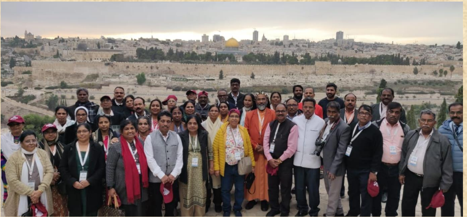
Near Jerusalem Old Temple