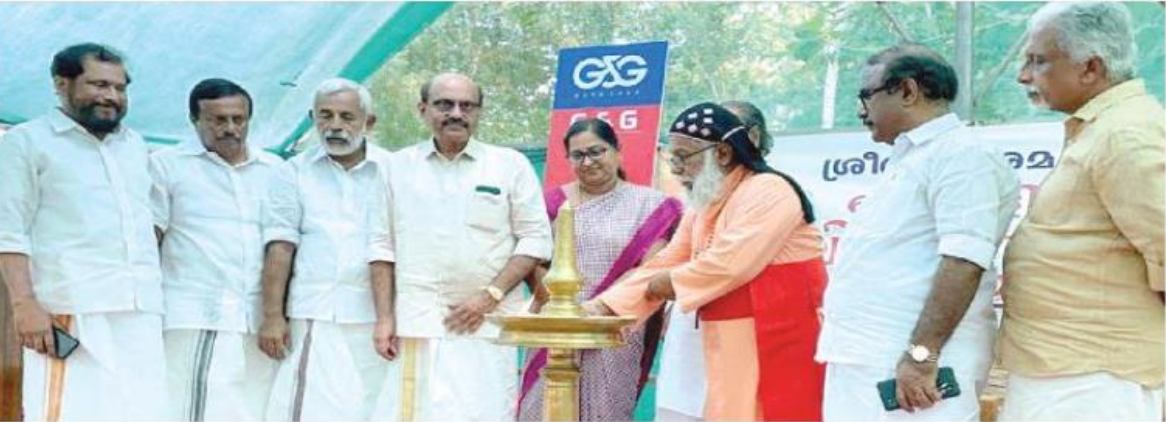
തെളിയൂർക്കാവ് വ്യശ്ചിക വാണിഭത്തോടനുബന്ധിച്ച് ആരോഗ്യ പ്രവർത്തകരെ ആദരിക്കുന്ന സമ്മേളനം കർദ്ദിനാൾ മാർ ബസേലിയോസ് ക്ലീമിസ് കാതോലിക്കാ ബാവ ഉദ്ഘാടനം ചെയ്യുന്നു.