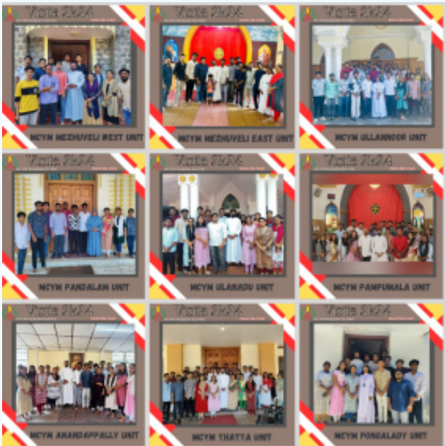
VISITA 2k24 9 യൂണിറ്റുകൾ ജില്ലാ സമിതി സന്ദർശിച്ചു.