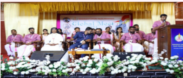
എം. സി. വൈ.എം. പത്തനംതിട്ട ഭദ്രാസനം, ത്രൈമാസ മാസിക