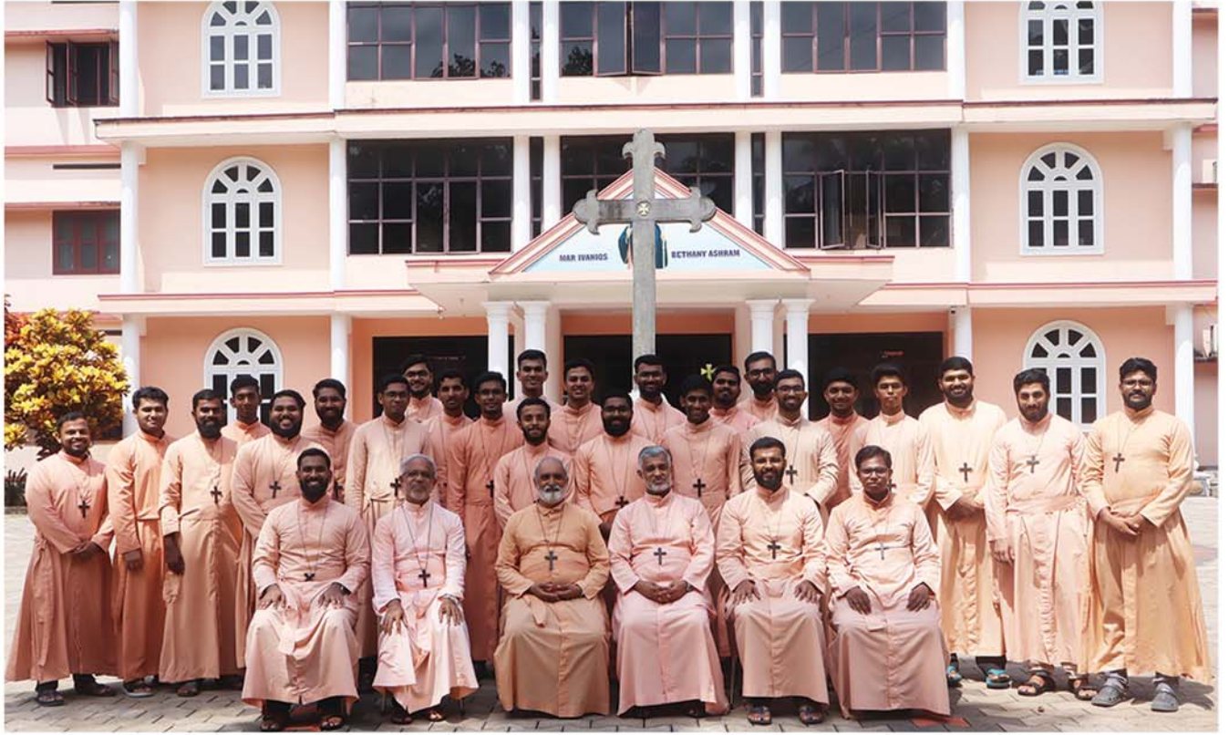
BROTHERS SANGAMAM AT JEEVARAM