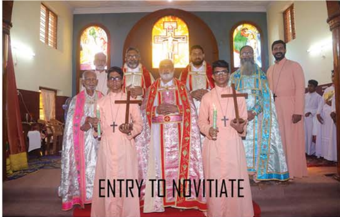
ENTRY TO NOVITIATE