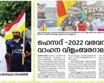
എം.സി.വൈ.എം. പത്തനംതിട്ട ഭദ്രാസനത്തിൽ പാത്രം സേവിക്കുകയും ചെയ്തു.