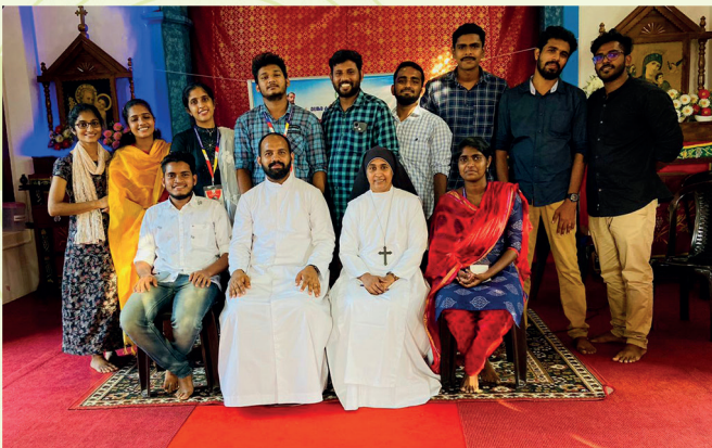
പന്തളം വൈദിക ജില്ല