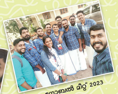
ഗ്ലോബൽ മീറ്റിംഗ് 2023