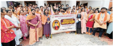
മോദൻപുഴയിൽ ഇറാനുമായി ബന്ധമുള്ളവരുടെ കർമ്മപരിപാടിയിൽ പങ്കെടുത്ത എം.സി.വൈ.എം. അംഗങ്ങൾ. ഇവർക്ക് പ്രത്യേക പരിഗണനയോടെ പാത്രം സേവിക്കുകയും ചെയ്തു.