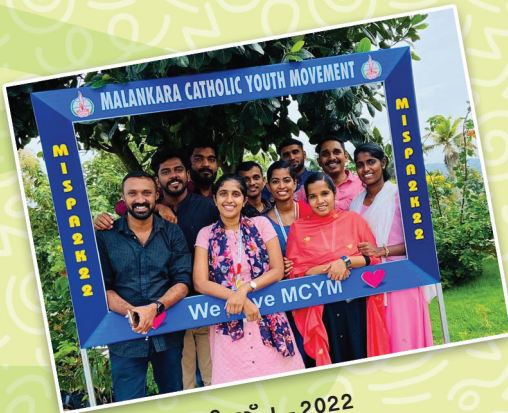
മിസ്പ - 2022