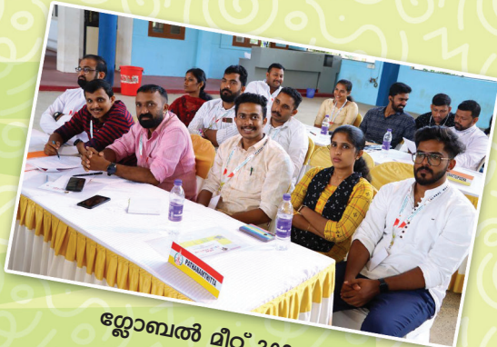
ഗ്ലോബൽ മീറ്റിംഗ് 2023