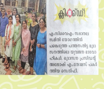
എം.സി.വൈ.എം. പത്തനംതിട്ട ഭദ്രാസനത്തിൽ പാത്രം സേവിക്കുകയും ചെയ്തു.