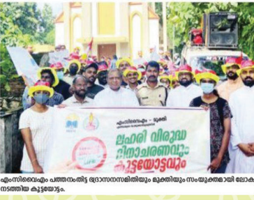
എം.സി.വൈ.എം. പത്തനംതിട്ട ഭദ്രാസനത്തിൽ പാത്രം സേവിക്കുകയും ചെയ്തു.