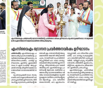
എം.സി.വൈ.എം. പത്തനംതിട്ട ഭദ്രാസനത്തിൽ പാത്രം സേവിക്കുകയും ചെയ്തു.