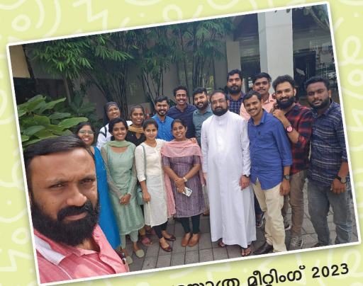
തീർത്ഥാടന പരയാത്ര മീറ്റിംഗ് 2023