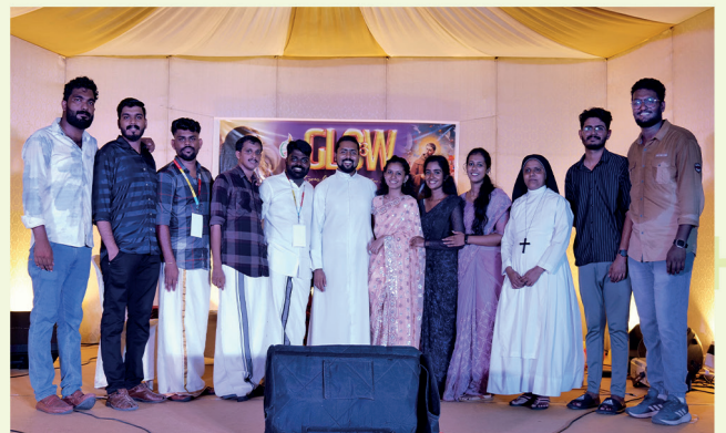
കോന്നി വൈദിക ജില്ല