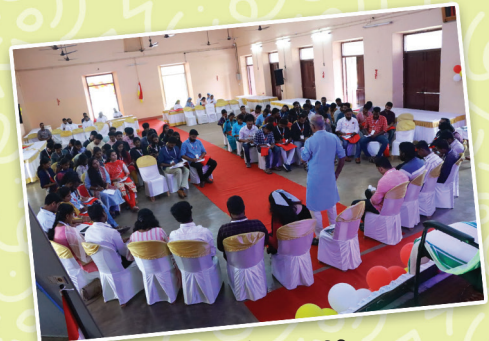
മിസ്പ - 2022