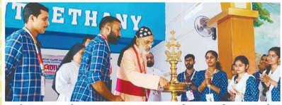
എം.സി.വൈ.എം. പത്തനംതിട്ട ഭദ്രാസനം ഉദ്ഘാടനം. 2022 മേയ് മാസം മുതൽ പാത്രം സേവിക്കുകയും ചെയ്തു.