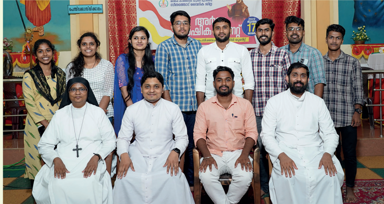
സിതത്തോട് വൈദിക ജില്ല