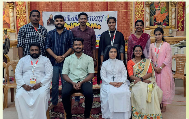
പത്തനംതിട്ട വൈദിക ജില്ല