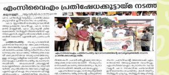
എം.സി.വൈ.എം. പ്രതിഷേധകാര്യമായ നടപടികൾ. പ്രതിഷേധത്തിന് കാര്യമായ പരിഹാരം കാണാൻ കഴിയാതെ വന്നു.

യുവോത്സവം-2022: കോന്നി വൈദികളിയ്യയ്ക്കു ചാവുൻഷീഷ്. യുവാക്കളുടെ വികാസത്തിനും സാമൂഹിക സേവനത്തിനും ഉദ്ദേശിച്ചാണ് ഈ പരിപാടി.