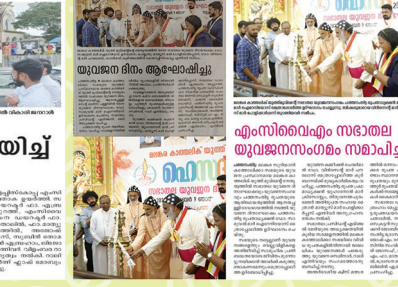
എം.സി.വൈ.എം. പത്തനംതിട്ട ഭദ്രാസനത്തിൽ പാത്രം സേവിക്കുകയും ചെയ്തു.