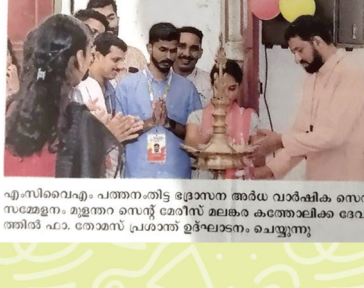
എം.സി.വൈ.എം. പത്തനംതിട്ട ഭദ്രാസനത്തിൽ പാത്രം സേവിക്കുകയും ചെയ്തു.

ഭദ്രാസന യുവജന സംഗമം നാളെ. യുവജന സംഗമം നടത്തി.