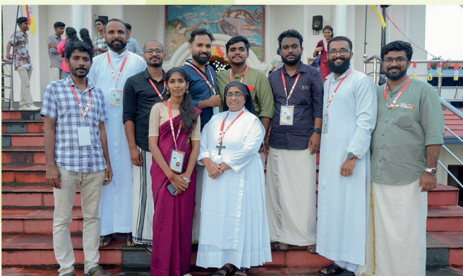
കാന്നി-പെരുന്മാട് വൈദിക ജില്ല