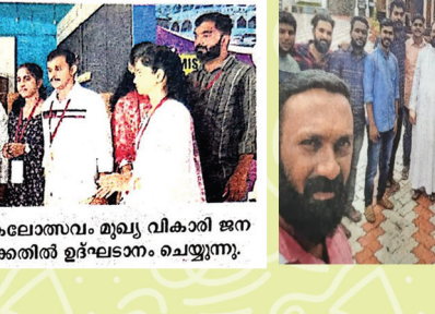
എം.സി.വൈ.എം. പത്തനംതിട്ട ഭദ്രാസനത്തിൽ പാത്രം സേവിക്കുകയും ചെയ്തു.