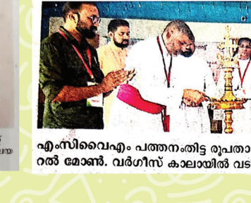
എം.സി.വൈ.എം. പത്തനംതിട്ട ഭദ്രാസനത്തിൽ പാത്രം സേവിക്കുകയും ചെയ്തു.