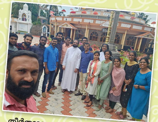
തീർത്ഥാടന പരയാത്ര മീറ്റിംഗ് 2023