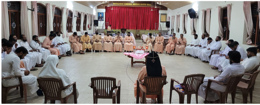
വൈദികരുടെ തുടർ പരിശീലന സമയത്ത് നടത്തിയ ലെക്സിയാ ദിവന