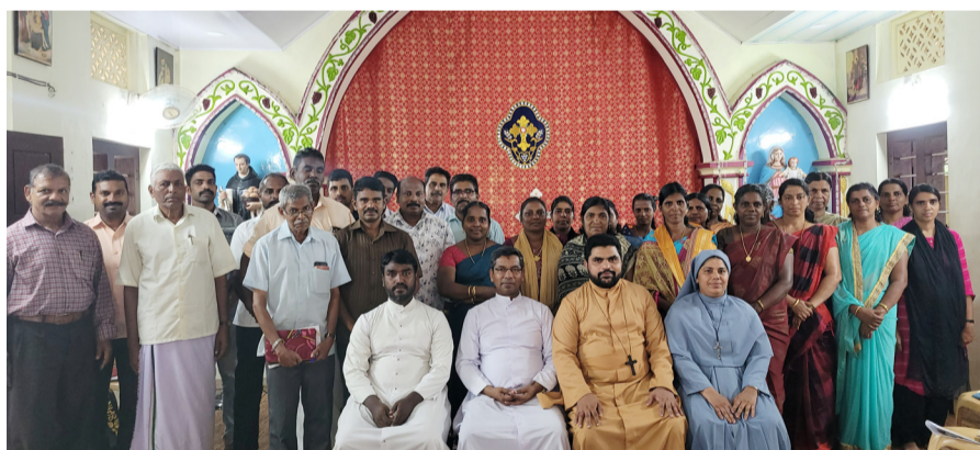
സുവിശേഷസംഘസംഗമം കൊല്ലംകോട് വൈദികജില്ല