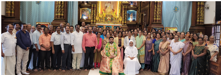
സുവിശേഷസംഘ രൂപീകരണം അടൂർ വൈദികജില്ല