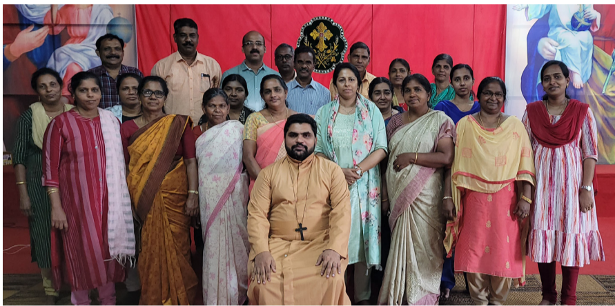
സുവിശേഷസംഘ പരിശീലനം അഞ്ചൽ വൈദികജില്ല