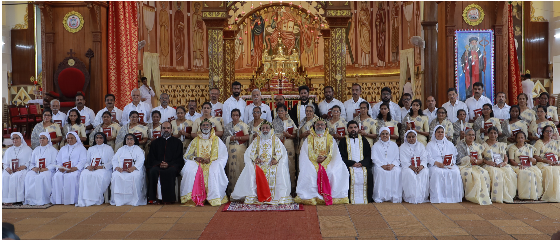
കൈവയ്പ്പ് ശുശ്രൂഷ സഭാതലം 8-ാം ബാച്ച്