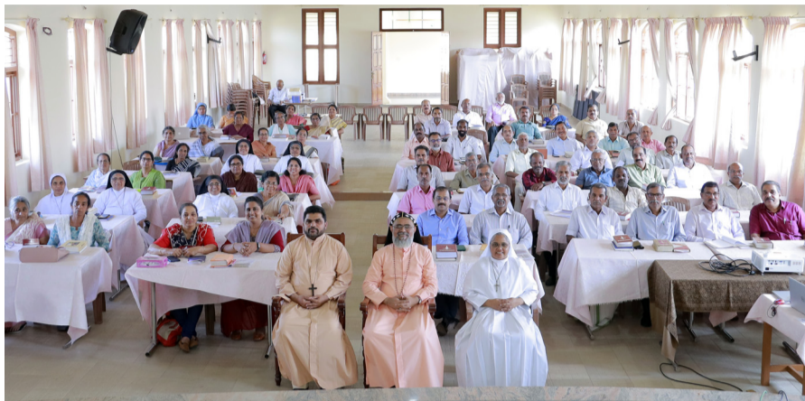
മിഷൻ പരിശീലനം കാതോലിക്കേറ്റ് സെന്ററിൽ