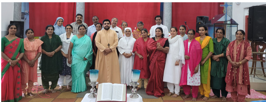
സുവിശേഷസംഘ പരിശീലനം മാനന്തവാടി വൈദികജില്ല