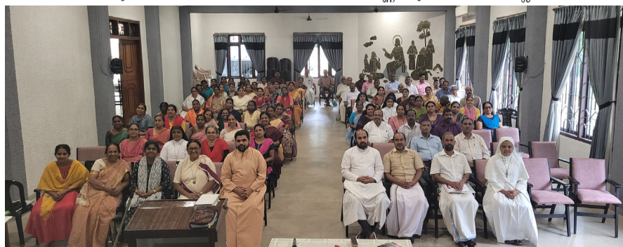
സുവിശേഷസംഘ പരിശീലനം തിരുവല്ല വൈദികജില്ല