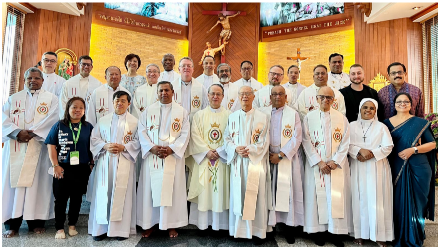
ഫെഡറേഷൻ ഫോർ ഏഷ്യൻ ബിഷപ്പ്സ് കൗൺസിൽ സുവിശേഷവൽക്കരണ കാര്യമായ സമ്മേളനം, ബാങ്കോക്ക്, തായ്‌ലാന്റ്