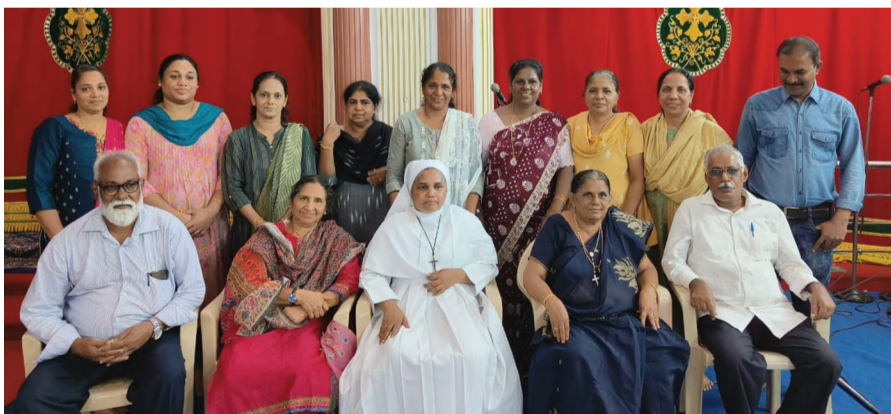
സുവിശേഷസംഘ പരിശീലനം മുറമ്പൈ വൈദികജില്ല