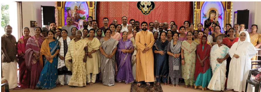
സുവിശേഷസംഘ പരിശീലനം പിറവം വൈദികജില്ല