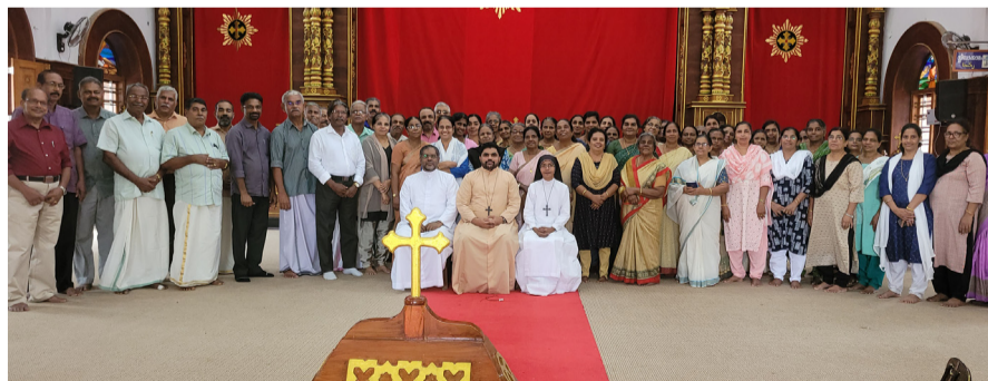
സുവിശേഷസംഘ പരിശീലനം റാന്നി-വെണ്ണിക്കുളം വൈദികജില്ല