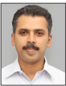
തയ്യാറാക്കിയത് : ഡോ. ജോജു ജോൺ ഭദ്രാസനതല സുവിശേഷസംഘാംഗം തിരുവനന്തപുരം മേജർ അതിഭദ്രാസനം