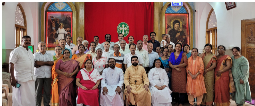
സുവിശേഷസംഘസംഗമം മാവേലിക്കര ഭദ്രാസനം