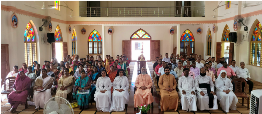
സുവിശേഷസംഘ രൂപീകരണം ദക്ഷിണ കന്നഡ വൈദികജില്ല