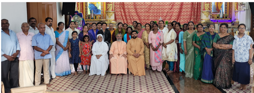
സുവിശേഷസംഘ പരിശീലനം ചെങ്ങന്നൂർ വൈദികജില്ല