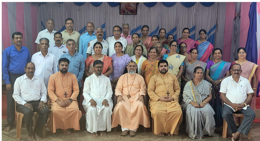
സുവിശേഷസംഘസംഗമം ദക്ഷിണ കന്നഡ വൈദികജില്ല