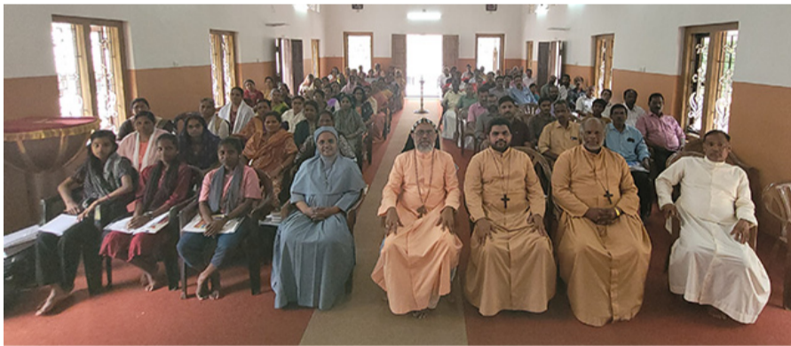
സുവിശേഷസംഘ രൂപീകരണം കണ്ണൂർ കാസർഗോഡ് വൈദികജില്ല