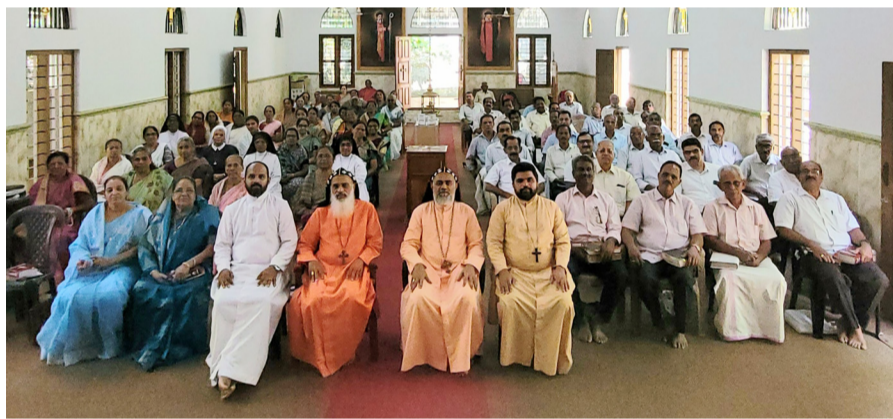
സുവിശേഷസംഘസംഗമം പത്തനംതിട്ട വൈദികജില്ല