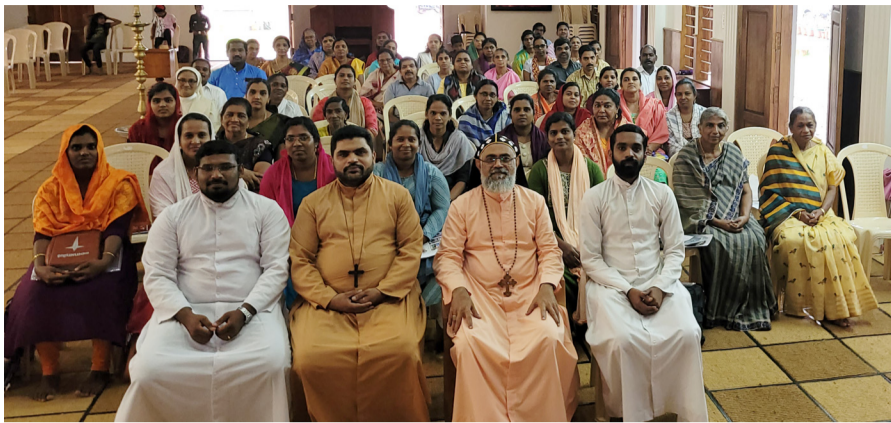
സുവിശേഷസംഘസംഗമം പാറശ്ശാല വൈദികജില്ല