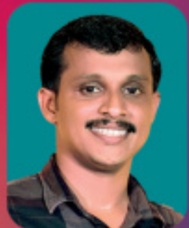
ബിബിൻ എബ്രഹാം പ്രസിഡന്റ്