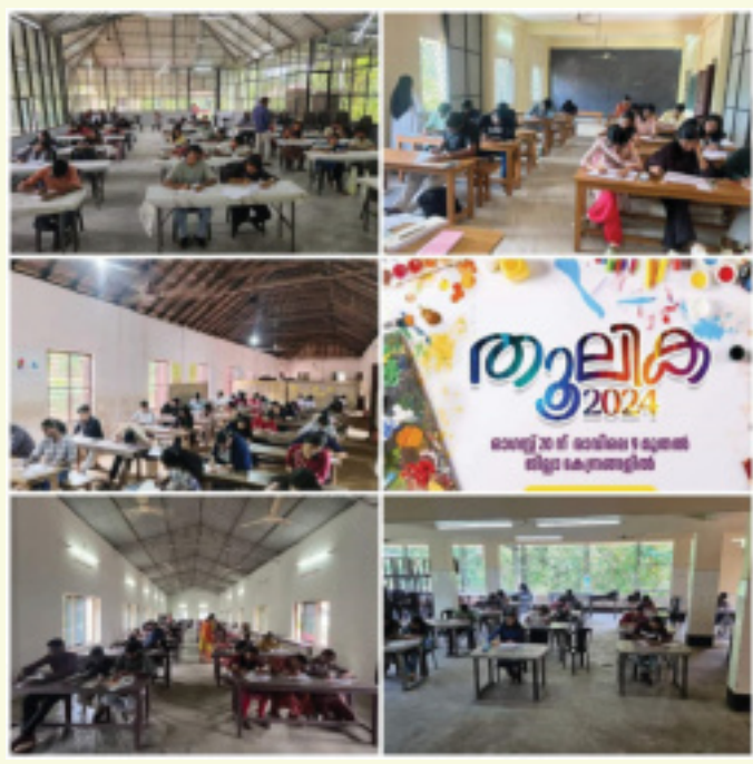
എം.സി.വൈ.എം പത്തനംതിട്ട ഭദ്രാസനത്തിലെ യുവജനങ്ങളുടെ സർഗാത്മക കഴി