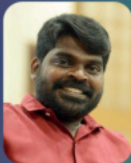
മിരാഖ് ഫി.എൽ. ട്രഷറർ