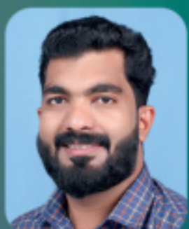
ലിജോ ഫിലിപ്പ് സഭാതല സിൻഡിക്കേറ്റ്