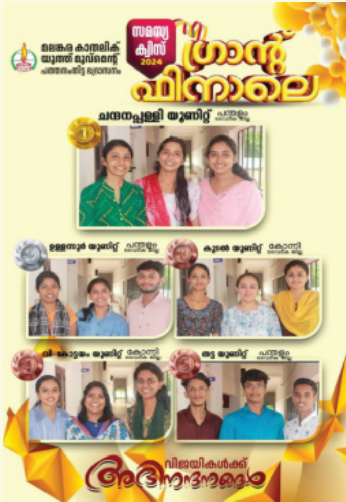
എം.സി.വൈ.എം ഭദ്രാസന യുവജന സംഗമത്തിന്റെ ലോഗോ പ്രകാശനം ചെയ്തു.