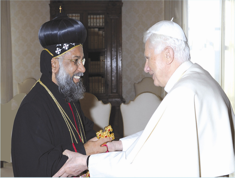
ബനഡിക്ട് മാർപാപ്പായും കർദ്ദിനാൾ ബസേലിയോസ് ക്ലീമീസും