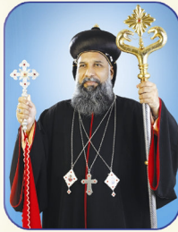
H.B. Moran Mar Baselios Cleemis