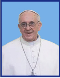
H. H. Pope Francis