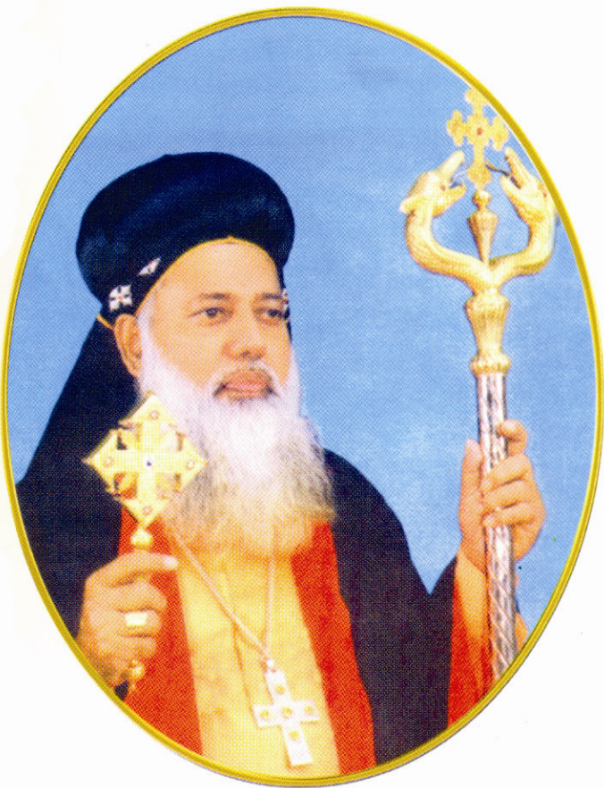
മേജർ ആർച്ചുബിഷപ്പ് സിറിൽ മാർ ബസേലിയോസ് (1935-2007)