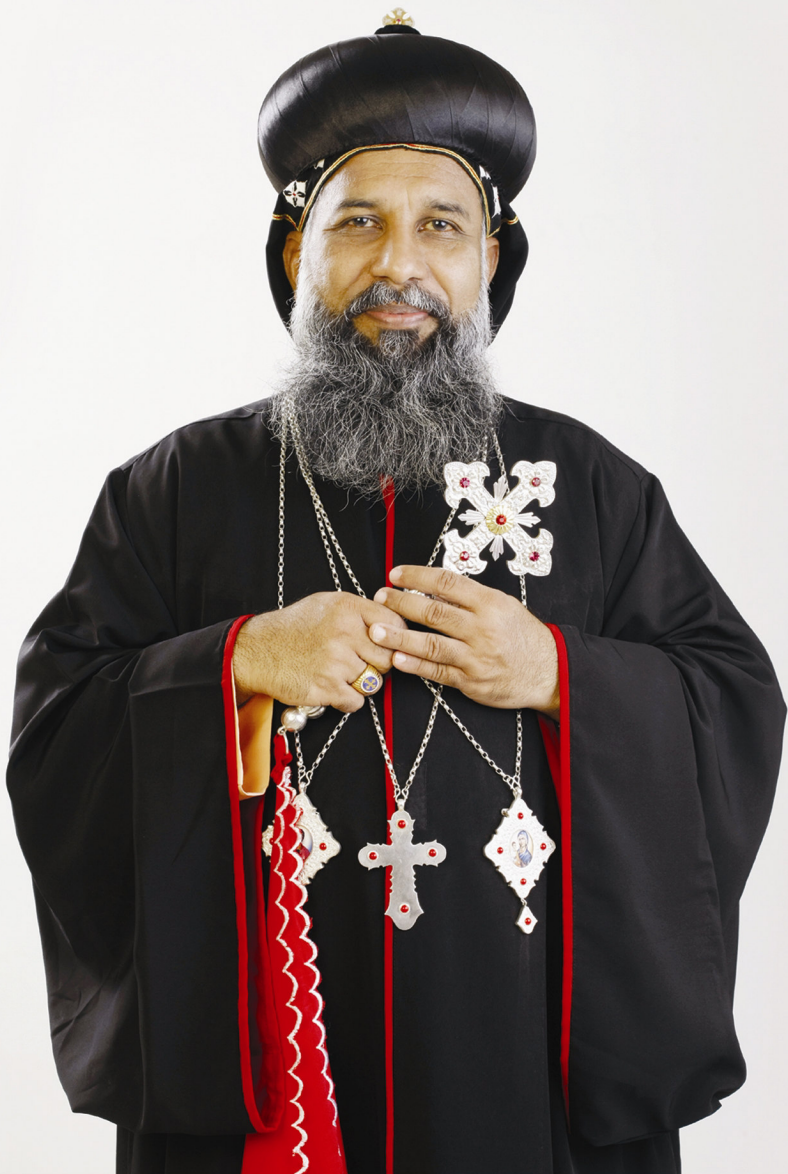
മേജർ ആർച്ചുബിഷപ്പ് ബസേലിയോസ് കർദിനാൾ ക്ലീമീസ് കാതോലിക്കാ ബാവ (1959- )