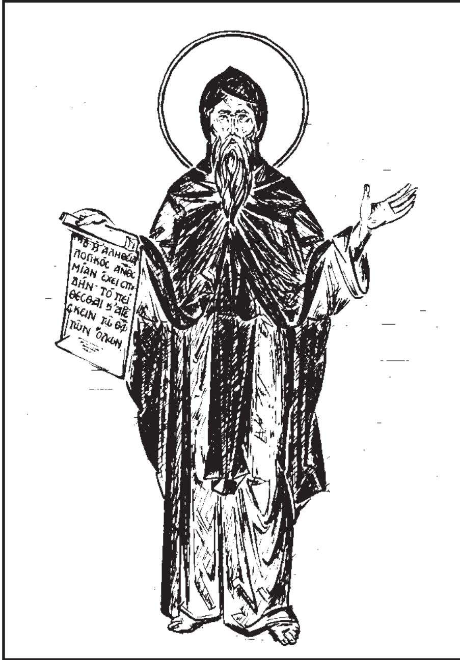
St. Antony the Great