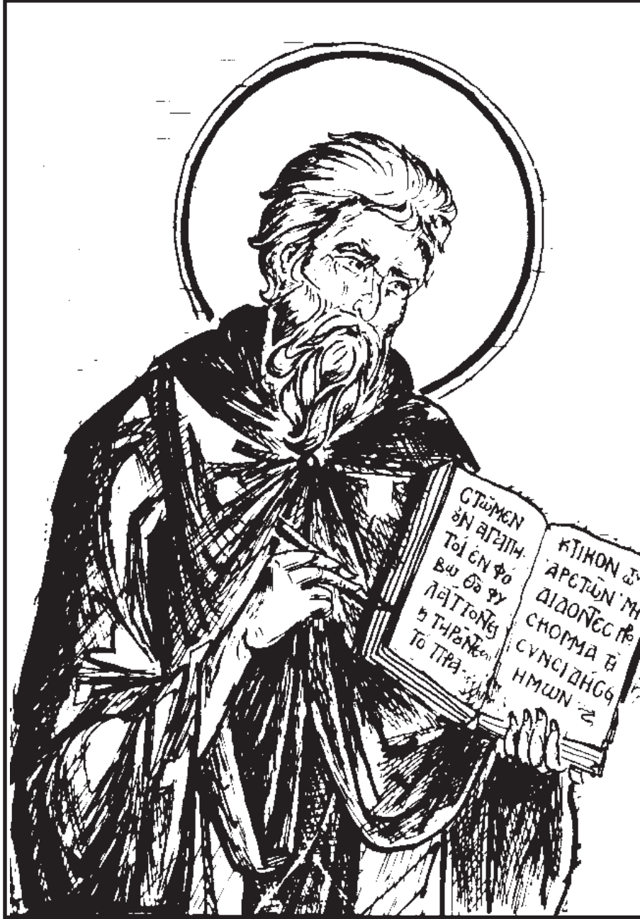
St. Isaiah the Solitary