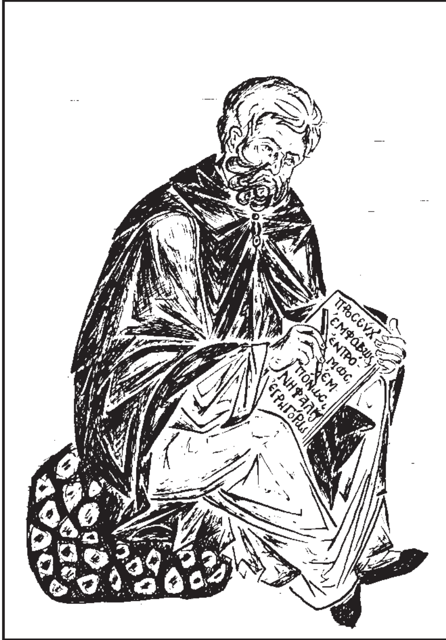
Evagrius the Solitary താപസനായ ഇവാഗ്രിയോസ്