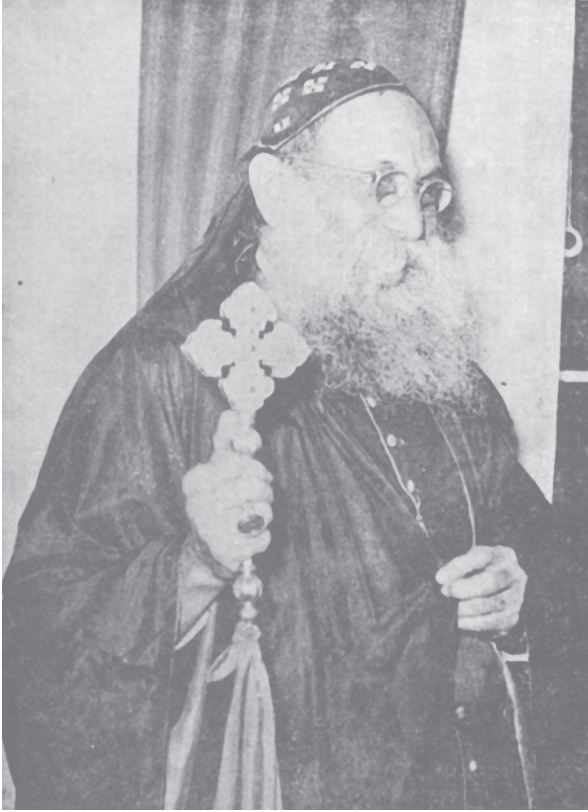
ആർച്ചുബിഷപ്പ് മാർ ഇസവാനിയോസ് മെത്രാപ്പോലീത്താ തിരുമനസ്സുകൊണ്ട് തിരുവനന്തപുരം അതിരൂപത