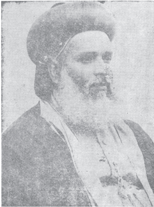
തിരുവല്ലാ ബിഷപ്പ് മാർ അത്താനാസിയോസ് തിരുമേനി