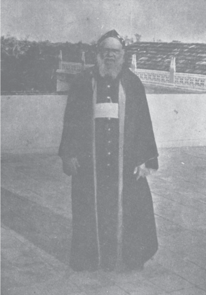
വന്ദ്യ. ദിവ്യശ്രീ ചേപ്പാട്ടു പീലിപ്പോസ് രമ്പാൻ (ഡോമസ്റ്റിക് പ്രീലറാ)