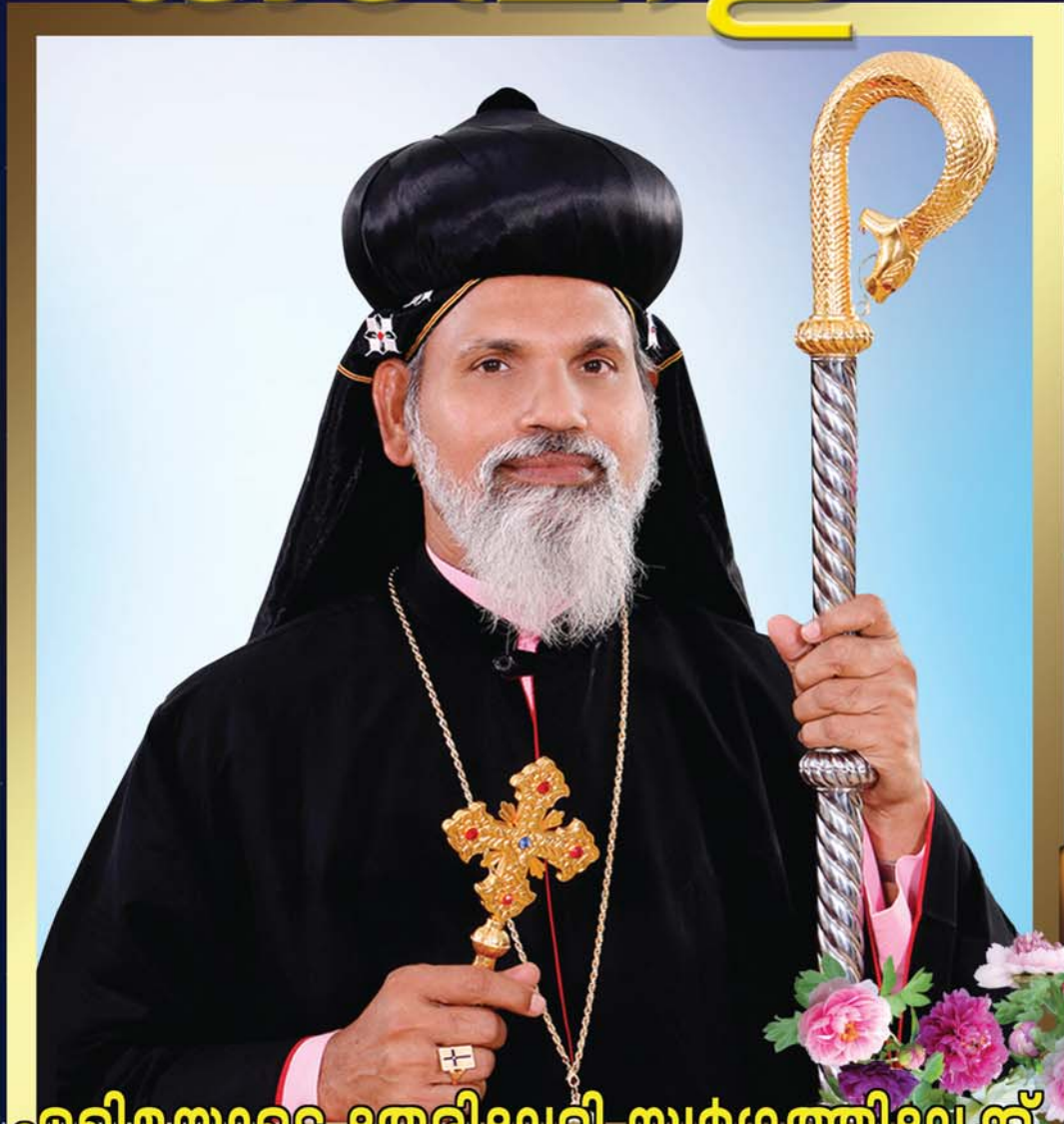
എളിമയുടെ തേരിലേറി സ്വർഗ്ഗത്തിലേക്ക് അഭിവന്ദ്യ ഗിവർഗ്ഗീസ് മാർ ദിവന്നാസിയോസ് മെത്രാപ്പോലീത്ത