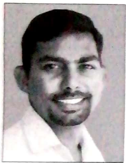
പ്രസിഡന്റ് ജോബിൻ ഇനോസ് വകയാർ