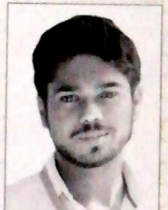
വൈസ് പ്രസിഡന്റ് ജെയിംസ് ജോസ് പൊന്നമ്പ്