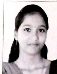
വൈസ് പ്രസിഡന്റ് ആൻ മരിയറ്റ് സ്റ്റീബ ഓമല്ലൂർ