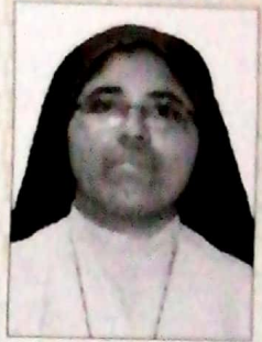
സിസ്റ്റർ ക്യപ എസ്. ഐ. സി