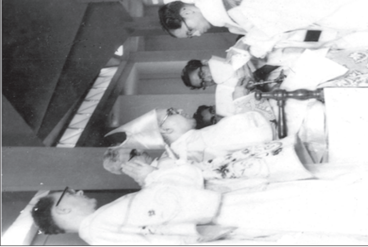
ബിഷപ്പ് വിശുദ്ധ തൈലം പുരട്ടുന്നു