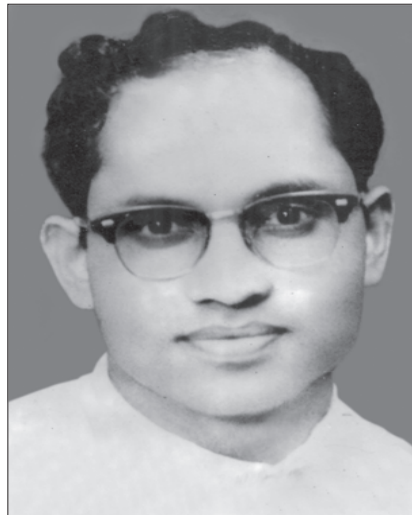
മൈനർ സെമിനാരി വൈസ് റെക്ടർ 1963