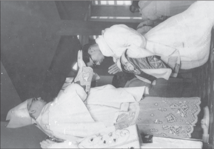
തിരുപ്പട്ടസീകരണം ഒക്ടോബർ 3, 1962