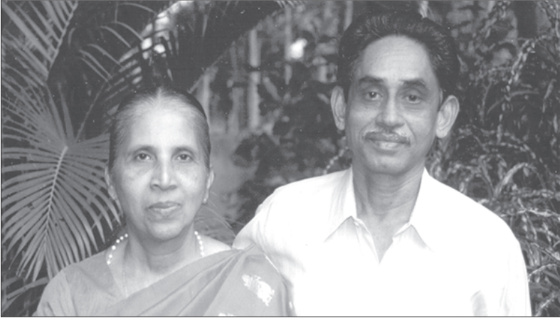
അനുജത്തിയും ഇളയ സഹോദരനും