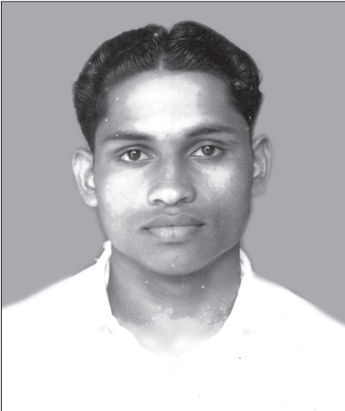
ബ്ര. സാമുവൽ മൈനർ സെമിനാരിയിൽ