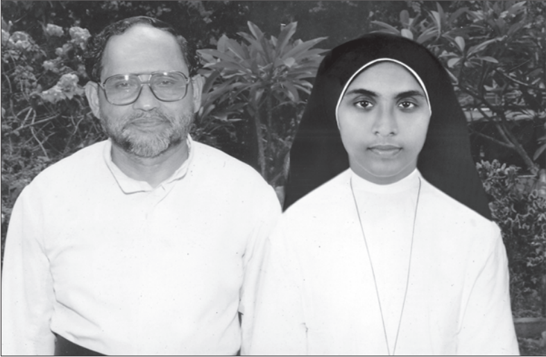
സഹോദരകൊച്ചുമാകൾ സി. സിസ്റ്റി