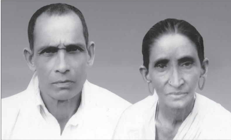
പിതാവ് (മത്തായി) മാതാവ് (റാഹേൽ)