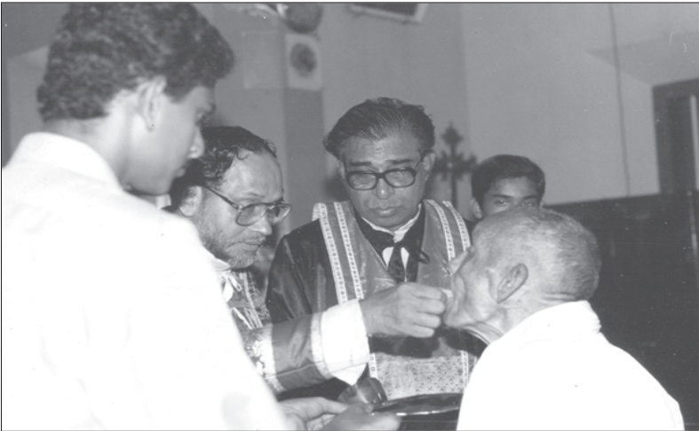
പിതാവിന്റെ 100-ാം വയസ്സിൽ വിശുദ്ധ കുർബാന നൽകുന്നു