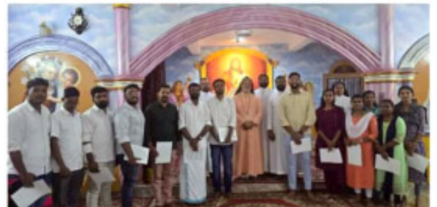
2024-25 വർഷത്തെ എം.സി.വൈ.എം. മാവേലി