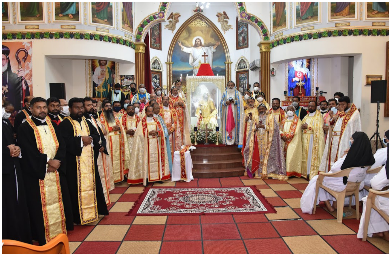
ശ്രേഷ്ഠാചാര്യ സമാധാനത്താലെ പോകുക