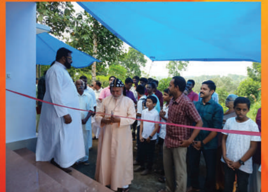
നവതി ഭവനത്തിന്റെ കുറാശ