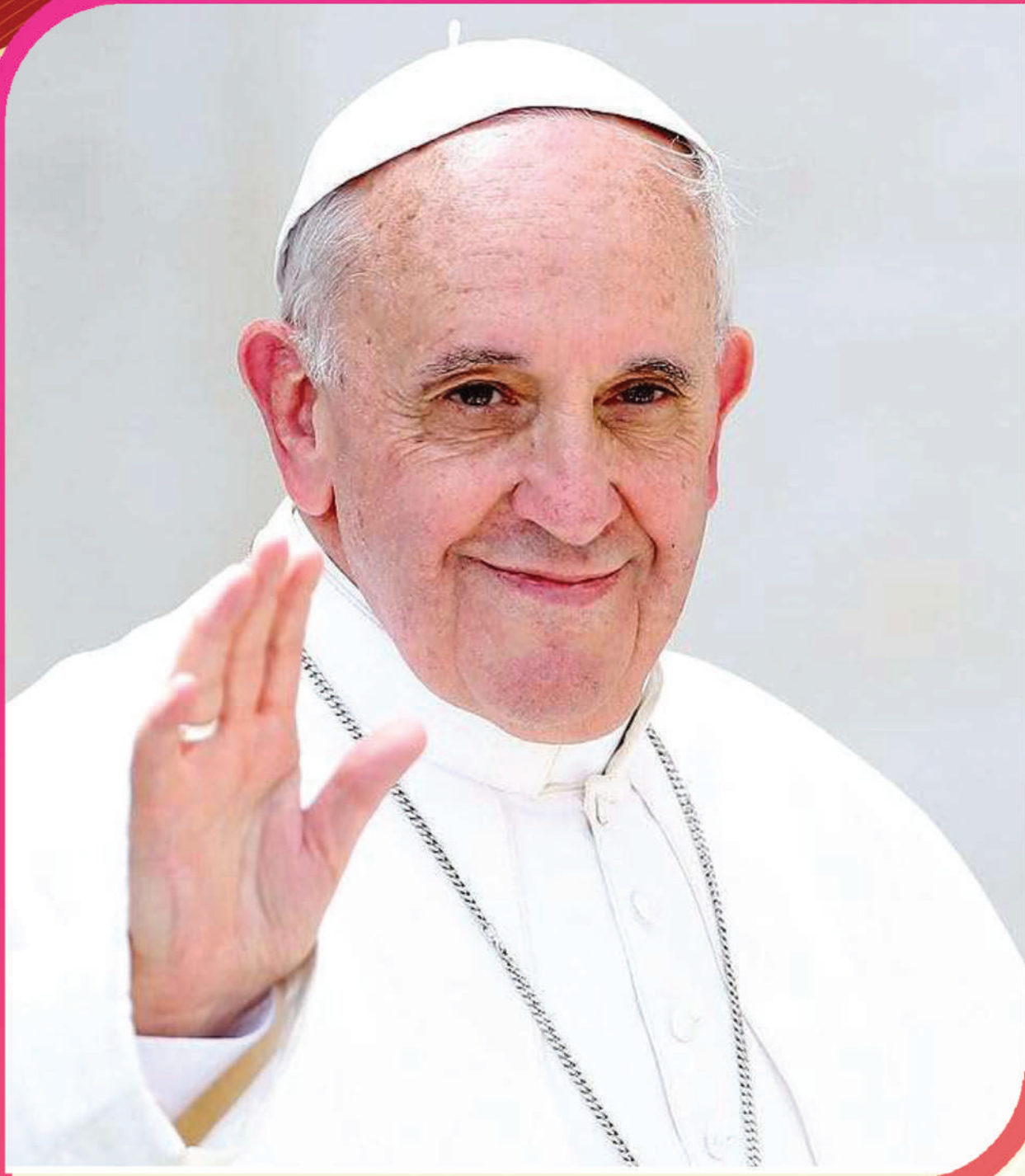
വിശ്വാസ ധാർമ്മികതയുടെ നവീന വക്താവ് പരിശുദ്ധ ഫ്രാൻസിസ് മാർപ്പാപ്പ