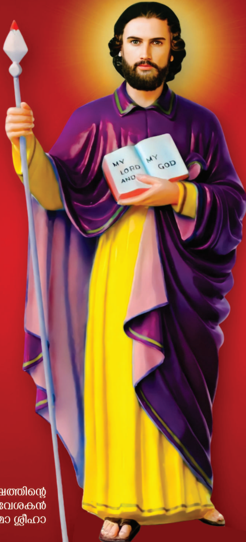
സുവിശേഷത്തിന്റെ ഭാരതപ്രവേശകൻ വിശുദ്ധ തോമാ ശ്ലീഹാ