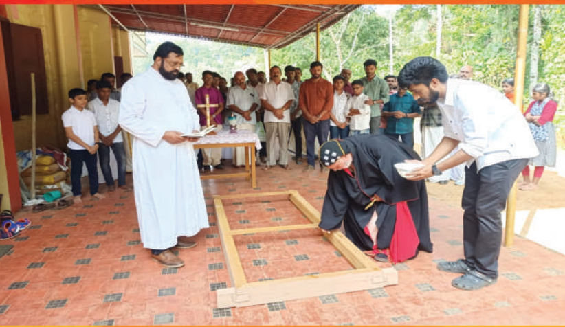
നവതിസ്ഥാപന ഓഫീസ് മന്ദിരം