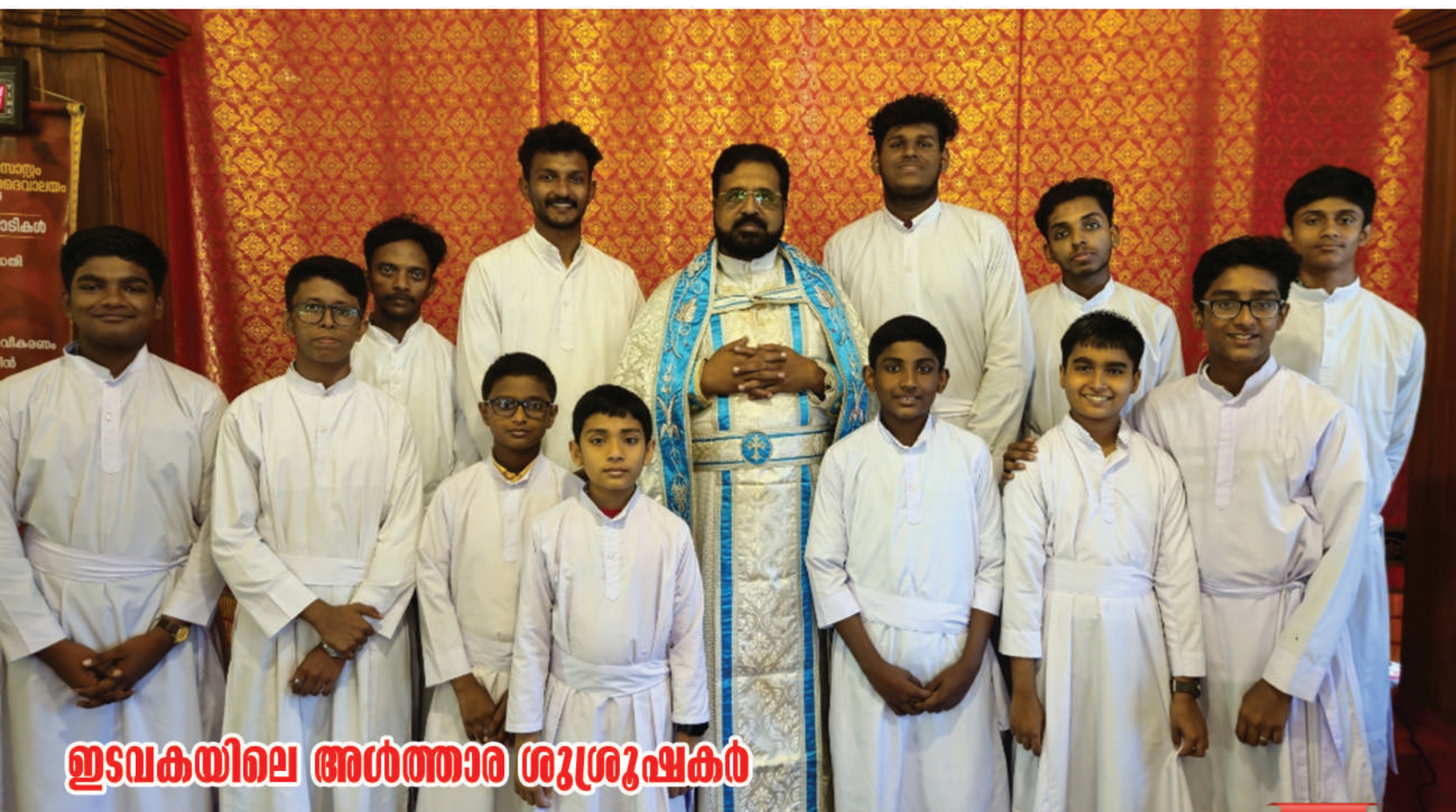
ഇടവകയിലെ അൾത്താര ശുശ്രൂഷകർ