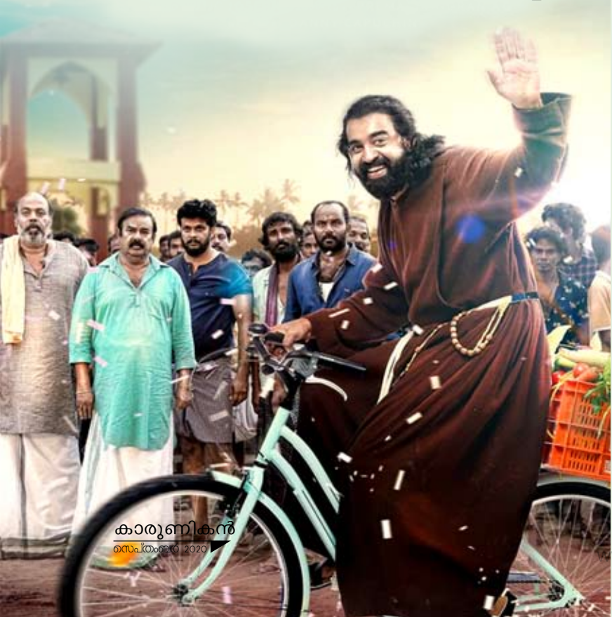
കാരുണികൻ സെപ്റ്റംബർ 2020