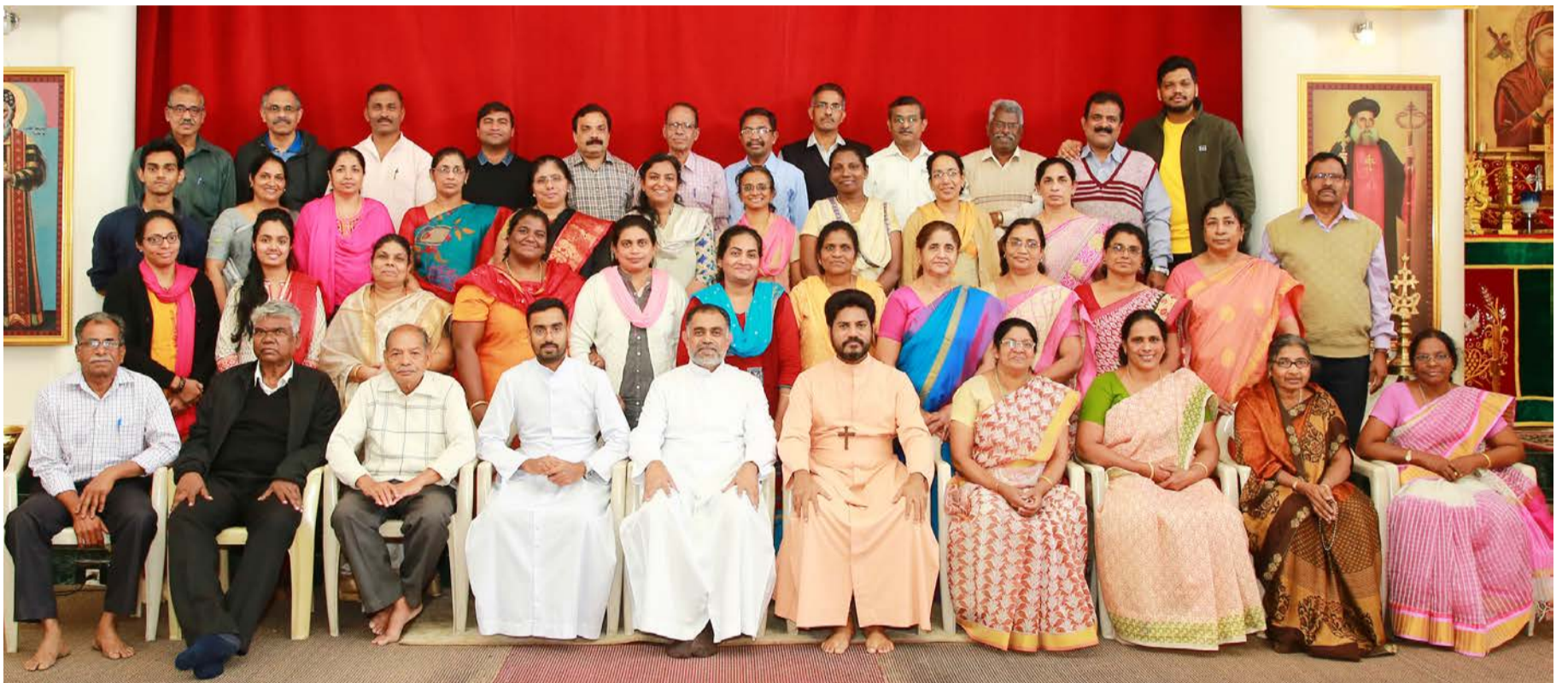
ഭദ്രാസനതല സുവിശേഷസംഘം കയ്കി - പുന ഭദ്രാസനം