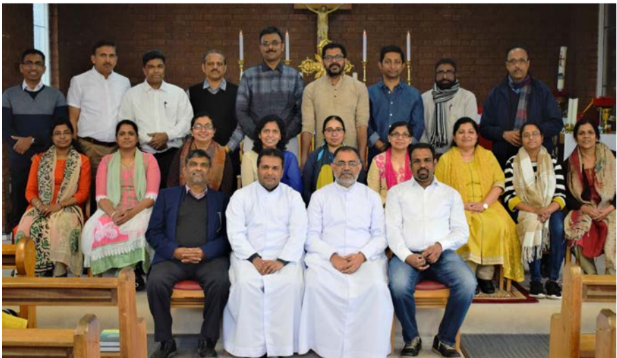
സുവിശേഷസംഘം പുതിയ ബാച്ച് ഇംഗ്ലണ്ട്