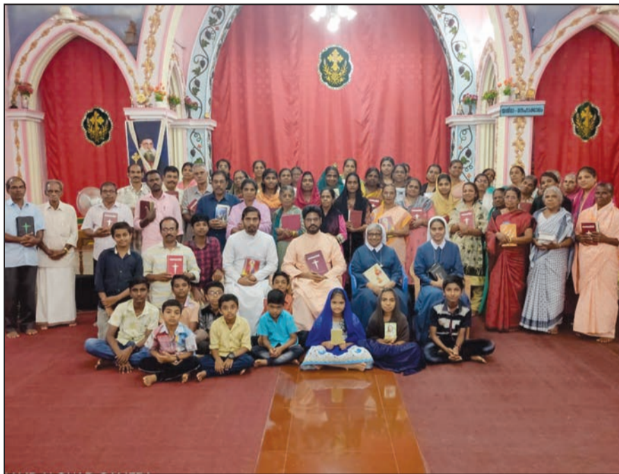
ലെക്സിയോ ദിവനാ മാവേലിക്കര ഭദ്രാസനം

അജപാലന ശുശ്രൂഷയിൽ ഒരുവൻ എപ്രകാരം വഴികാട്ടി ആകണം എന്നുള്ളതിന് തന്റെ ജീവിതംകൊണ്ട് തയ്യാറാകുമ്പോൾ അത് ഫലപ്രാപ്തിയിലെത്തും. ലക്ഷ്യം നേടിയെടുക്കാൻ ആടിന്റെ മണം, ആടിന്റെ സ്വഭാവം, ആടിന്റെ പ്രവൃത്തി ഇതെല്ലാം നിരന്തരം അറിഞ്ഞ് നയിക്കാൻ തയ്യാറാകണം. അജപാലന ശുശ്രൂഷയിൽ എല്ലാവരെയും തൃപ്തിപ്പെടുത്താൻ സാധിച്ചെന്ന്വരില്ല അപ്പോൾ മിശിഹായുടെ വഴിയിലൂടെ യാത്രചെയ്യുക എന്നുള്ളതാണ്. നിത്യപുരോഹിതനായ മിശിഹാ തന്റെ ജീവിതത്തിൽ നൽകിയ മൂല്യങ്ങളും, പഠിപ്പിക്കലും നിരന്തരം നൽകുക എന്നുള്ളതാണ്.