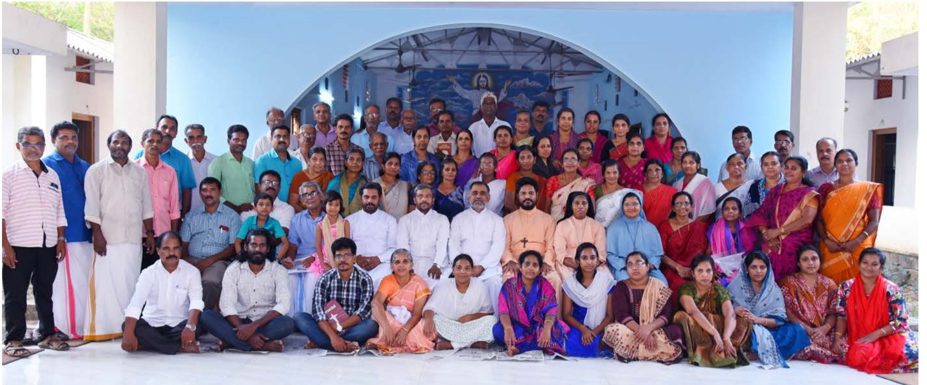
ഭദ്രാസനതല സുവിശേഷസംഘം ബത്തേരി രൂപത നിലമ്പൂർ മേഖല