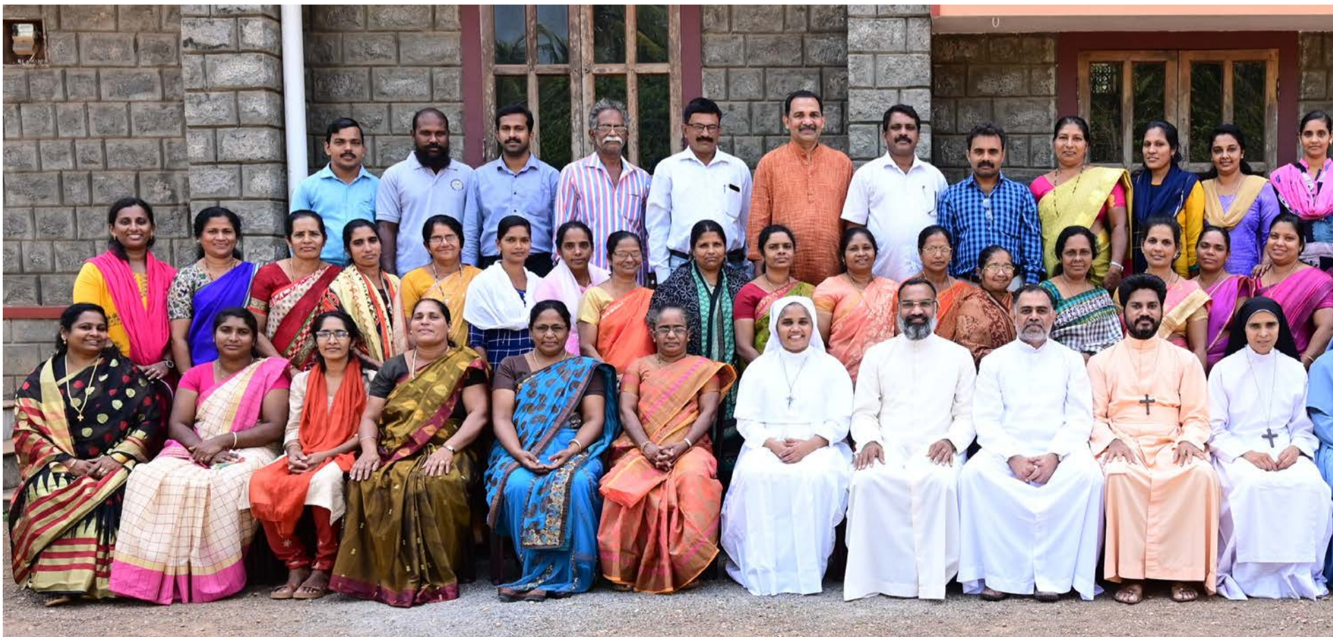
ഭദ്രാസനതല സുവിശേഷസംഘം 3-ാം ബാച്ച്, പുത്തൂർ ഭദ്രാസനം

2020 ഫെബ്രുവരി 14, 15, 16 തീയതികളിൽ ഇംഗ്ലണ്ടിൽ പുതിയ ഒരു ബാച്ച് നില