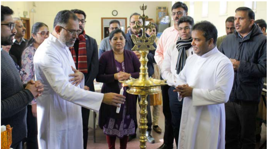
സുവിശേഷസംഘം ഫോർമേഷൻ പ്രോഗ്രാം, ഇംഗ്ലണ്ട്

2020 മാർച്ച് 6-ാം തീയതി മുവാറ്റുപുഴ ഭദ്രാസനത്തിൽ പീച്ചി മേഖലയിലെ സുവിശേഷസംഘ പരിശീലന പരിപാടി നടക്കുകയുണ്ടായി.