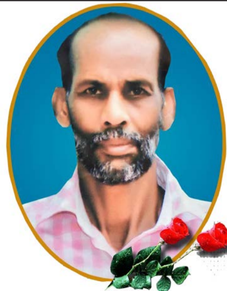
സ്കറിയ ചാക്കോ തിരുവല്ല