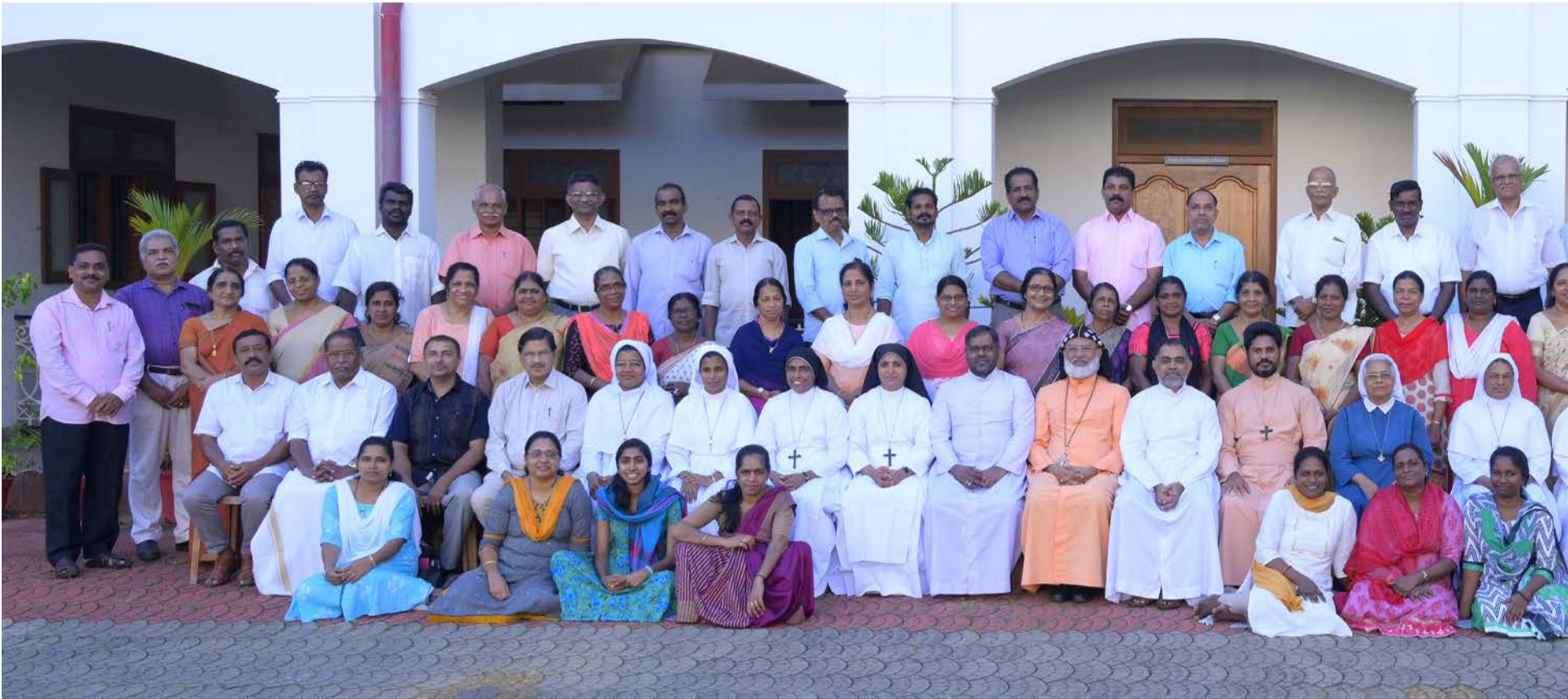
സഭാതലസുവിശേഷസംഘം 8-ാം ബാച്ച് പട്ടം കാത്തോലിക്കേറ്റ് സെന്റർ