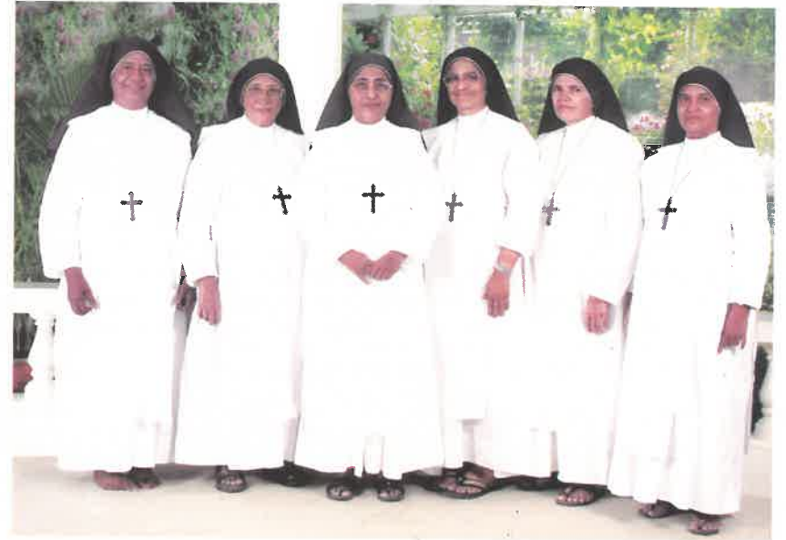
ബഥനി ജനറലേറ്റ് സാരഥികൾ