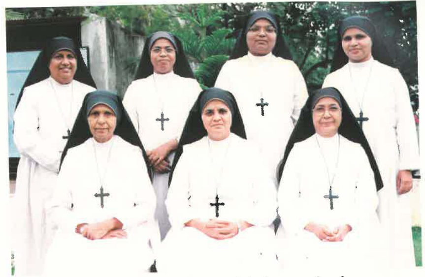
തിരുവനന്തപുരം പ്രോവിൻസ് സാരഥികൾ

ബഥനിയിൽ നടക്കുന്ന ആഘോഷ പരിപാടികൾ വെറും ആഘോഷങ്ങളായിമാത്രം പരിഗണിക്കപ്പെടുന്നില്ല. സമൂഹാംഗങ്ങൾ ഒന്നിച്ചുകൂടുന്നതിനും പരസ്പരം കൂടുതൽ അറിയുന്നതിനും സൗഹൃദം പുലർത്തുന്നതിനുമുള്ള വേദികൾകൂടിയാണ് അവ. തന്നെയുമല്ല സഭയുടെ, ദേശത്തിന്റെ സാമൂഹ്യസാംസ്കാരികപൈതൃകങ്ങൾ വിലമതിക്കുന്നതിനും വ്യക്തിത്വ വളർച്ചയ്ക്കും ഇങ്ങനെയുള്ള പരിപാടികൾ സഹായകമെന്നും സന്യാസത്തിൽ ഇവയൊന്നും നിഷിദ്ധമല്ലെന്നും സിസ്റ്റേഴ്സ് ബോധ്യപ്പെടുന്നതിന് ഉപകരിക്കുന്നു.