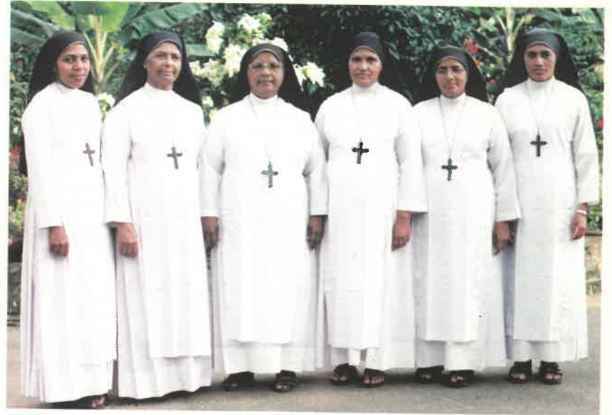
ബത്തേരി പ്രോവിൻസ് സാമരികൾ