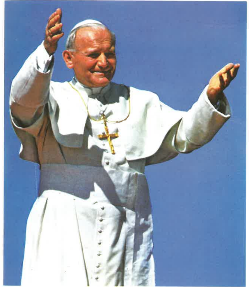
പരിശുദ്ധ ജോൺ പോൾ രണ്ടാമൻ മാർപ്പാപ്പ