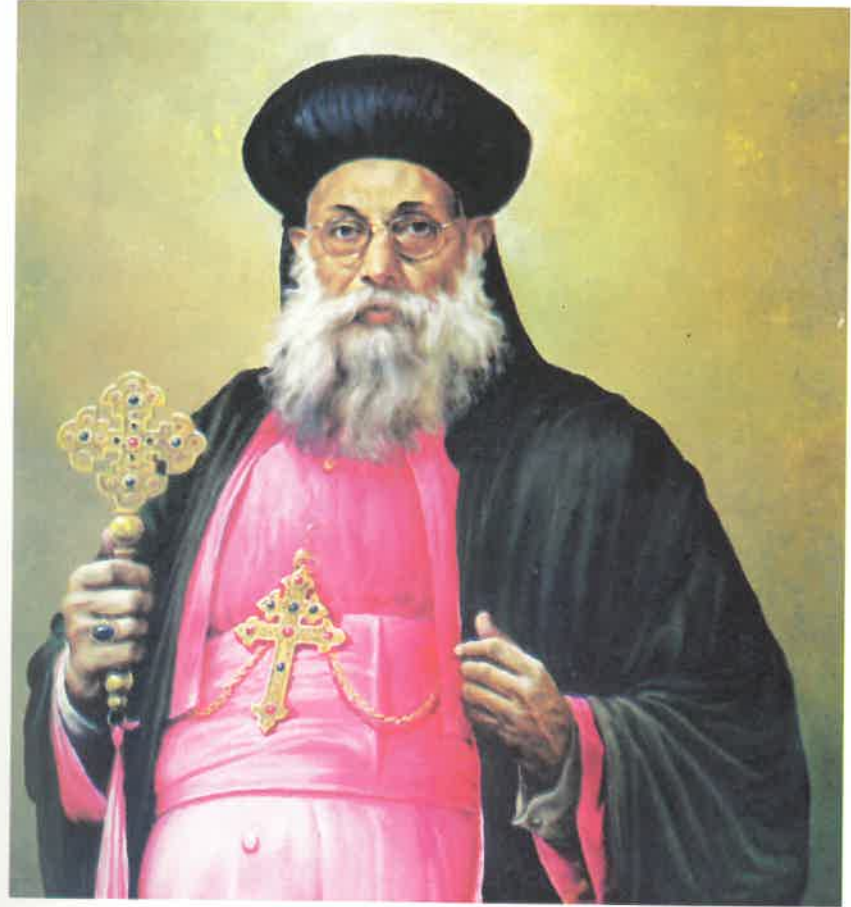
ബഥനി സ്ഥാപകൻ അഭിവന്ദ്യ മാർ ഇസ്രായീലായോസ് തിരുമേനി