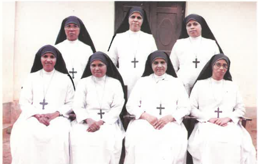
പത്തനംതിട്ട പ്രൊവിൻസ് സാരഥികൾ

വിദേശങ്ങളിൽ സിസ്റ്റേഴ്സ് ത്യാഗബുദ്ധ്യം അനുഷ്ഠിക്കുന്ന എല്ലാ സേവനവും തികഞ്ഞ പ്രേഷിത പ്രവർത്തനങ്ങൾ തന്നെ. അതുപോലെ തന്നെ പ്രൊവിൻസിന്റെ സാമ്പത്തിക ഭദ്രതയ്ക്ക് ശക്തമായ താങ്ങായിരിക്കുന്നു എന്നതും മറക്കാവതല്ല.