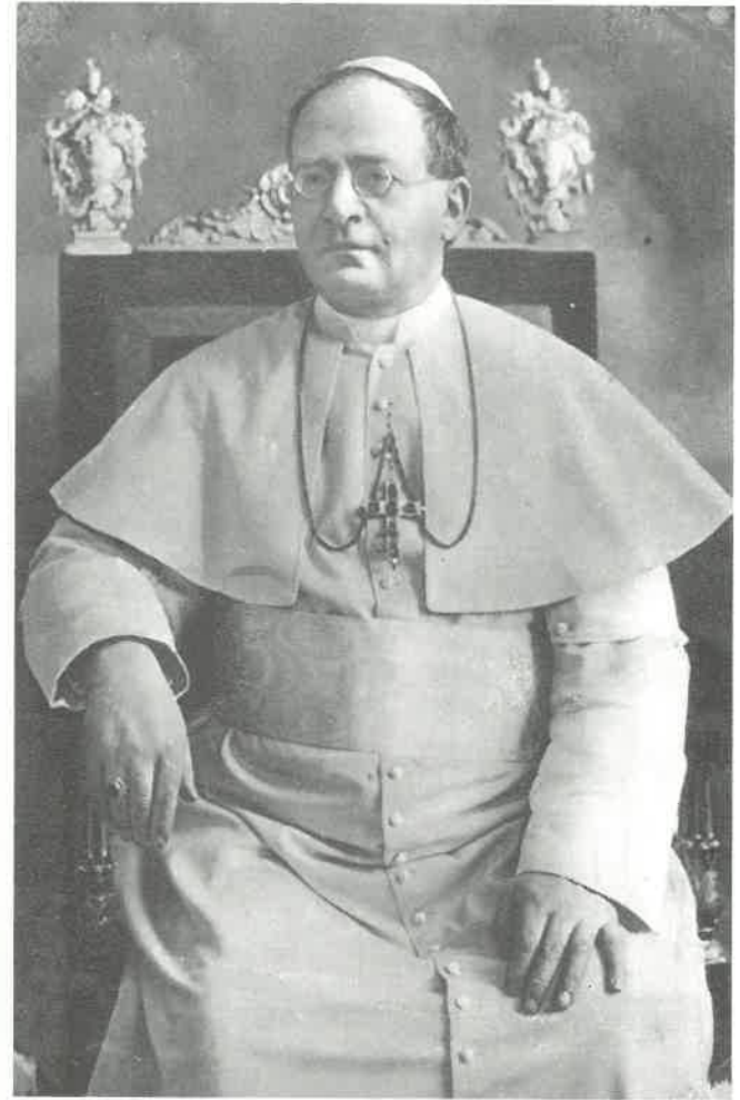
പരിശുദ്ധ പീയൂസ് പതിനൊന്നാമൻ മാർപ്പാപ്പ