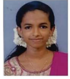
ക്ലാസ്സ് 12 ജാൻസി ജെ എസ് കറ്റിയാനി - കഴക്കൂട്ടം