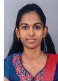
റ്റിന എ. എസ് ഖണ്ഡലം ഇടവക തിരുവനന്തപുരം വൈദികജില്ല 96 മാർക്ക് A+