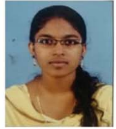
ക്ലാസ്സ് 11 ആൻസി എ എ കറ്റിയാനി - കഴക്കൂട്ടം