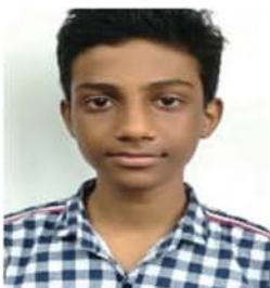
ക്ലാസ്സ് 7 ജോബിൻ എസ് കാരുവട്ടം - കഴക്കൂട്ടം