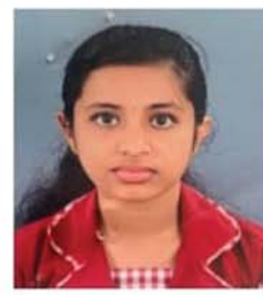
ക്ലാസ്സ് 10 ആഷിക സിബി നരിക്കൽ - പുന്നലൂർ