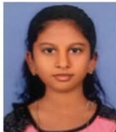
ക്ലാസ്സ് 5 റിയ ബ്യൂൽ റോബിൻ നരിക്കൽ - പുന്നലൂർ