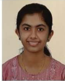
റ്റിൻസ തോമസ് വയല ഇടവക അട്ടർ വൈദികജില്ല 98 മാർക്ക് A+