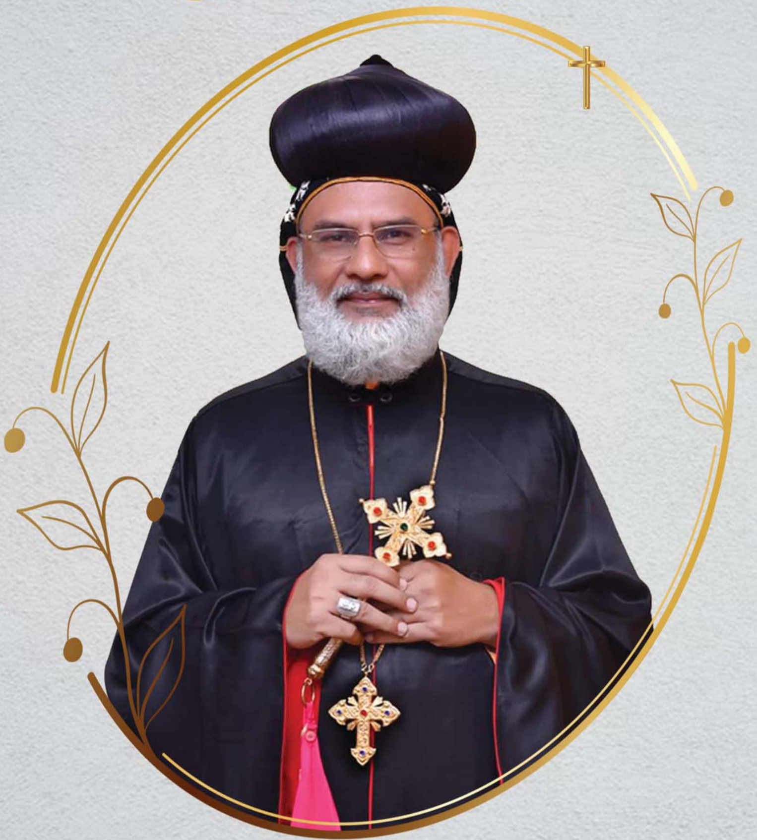
അഭിവന്ദ്യ ജേക്കബ് മാർ ബർണ്ണബാസ് മെത്രാപോലീത്ത (ഗൂഡ്ഗാവ് രൂപതാധ്യക്ഷൻ)