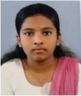
ക്ലാസ്സ് - എൽ കെ ജി ആൻസി ലാൽ മാത്യു പൊങ്ങുട് - തിരുവനന്തപുരം