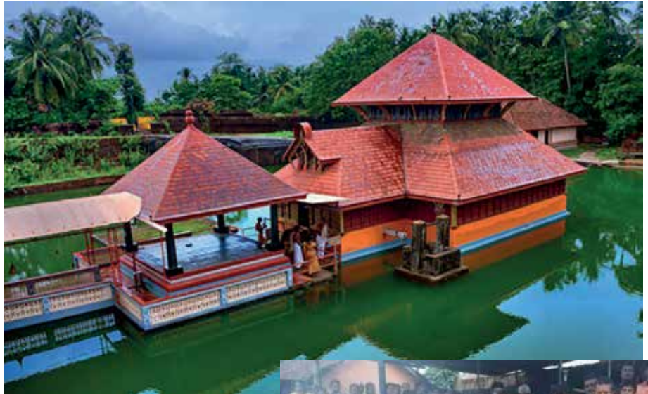
കവള അനന്തപുരം പത്മനാഭസ്വാമിക്ഷേത്രം