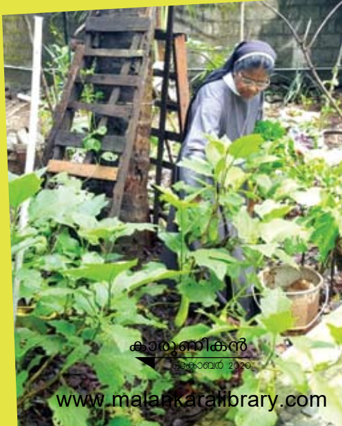
കാശ്മീരികൻ ഒക്ടോബർ 2020

അധ്യാപികയുടെ കൃഷിസന്ദേഹം ദൈവ്യാപികയെന്ന നിലയിൽ സി. ആന്റിസിന് നിരീക്ഷണപാടവം കൂടുതലായിരുന്നു. അത് തന്റെ വിദ്യാർത്ഥികളെ പഠിപ്പിക്കുന്നതിനുവേണ്ടി മാത്രമായിരുന്നില്ല. പ്രകൃ