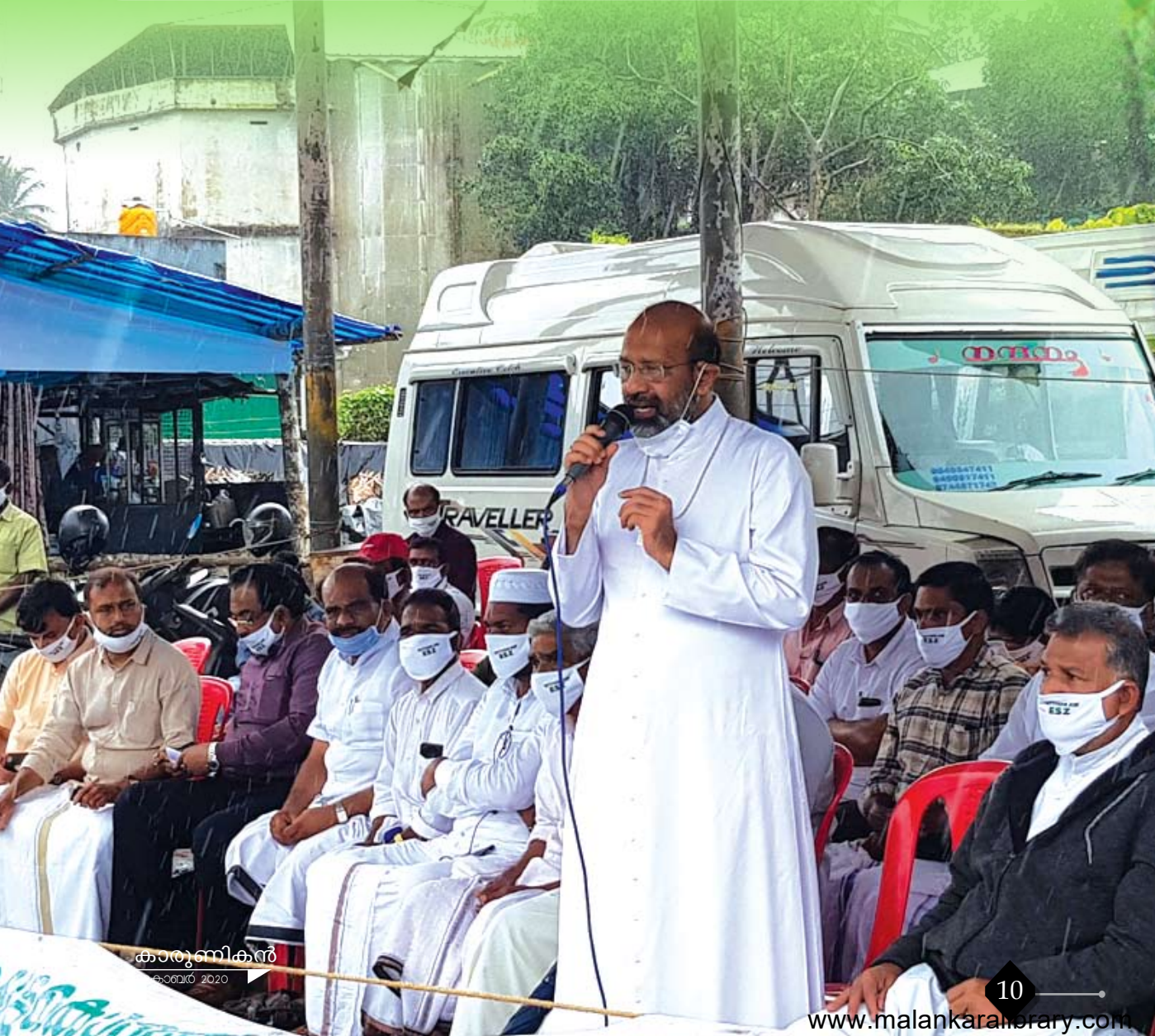
കാരുണികൻ ഓഗസ്റ്റ് 2020

കർഷകരുടെ സംരക്ഷണത്തിനായി ധാരാളം പദ്ധതികൾക്ക് അടുത്തനാളുകളിലായി രൂപം നൽകിയിട്ടുണ്ട്. 'പള്ളിക്കൊപ്പം പള്ളിച്ചത്' എന്ന മുദ്രാവാക്യം ആണ് ഞങ്ങൾ സ്വീകരിച്ചിട്ടുള്ളത്. സാധാരണക്കാരായ കർഷകരുടെ പക്കൽനിന്നും കാർഷികോ