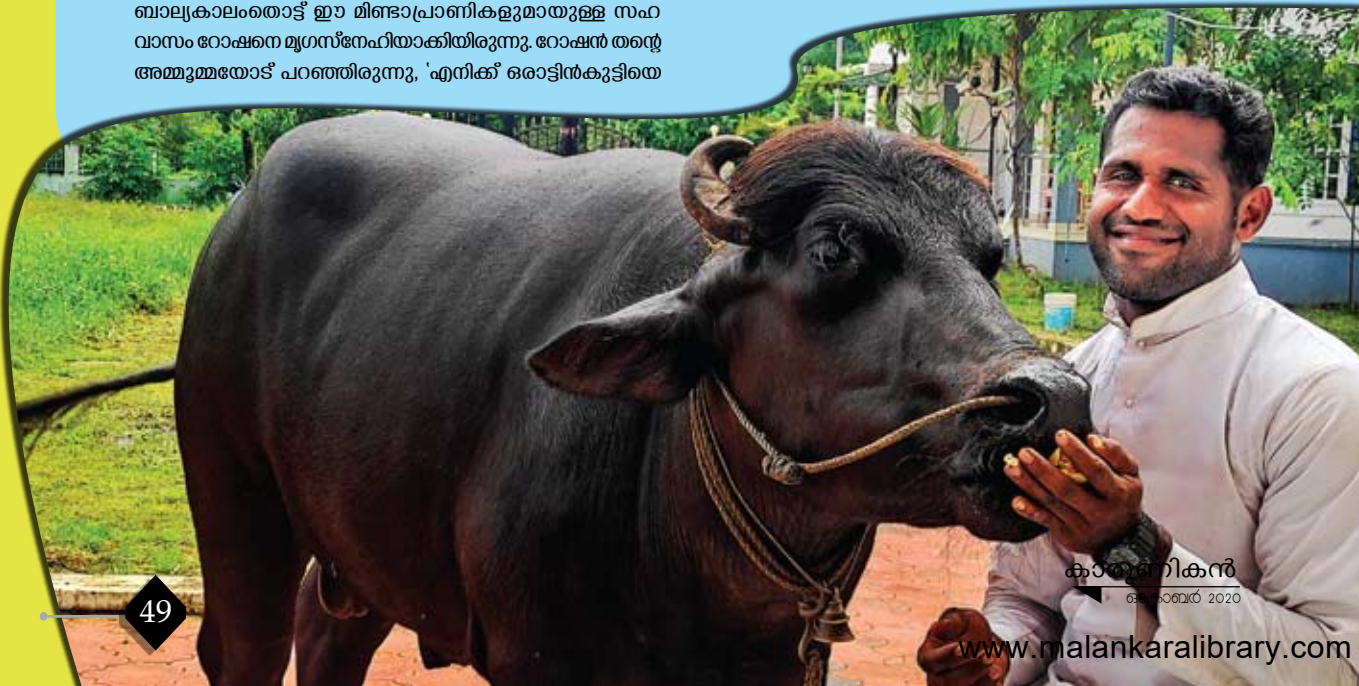
കാർമ്മൽഗിരികൻ ഒക്ടോബർ 2020

പക്ഷി-മൃഗസന്ദർശനം റോഷനിൽ രൂപമുദ്രമായിരുന്നെങ്കിലും തന്റെ ജീവിതാന്തസ് മനുഷ്യരെ പിടിക്കുന്നവനാകലാണെന്ന തിരിച്ചറിവ് പത്താംക്ലാസിലെത്തിയപ്പോൾ ബോധ്യമായി. ആ ബോധ്യം 2001 ജൂലൈ മുനിസിപ്പൽ റോഷനെ കളമശ്ശേരി വിയാനിഹോമിലെത്തിച്ചു. ലക്ഷ്യം മുനിസിപ്പൽകണ്ടുകൊണ്ടുള്ള യാത്രയിൽ കാർമ്മൽഗിരി സെന്റ് ജോസഫ്സ് പൊന്തിപിക്കൽ