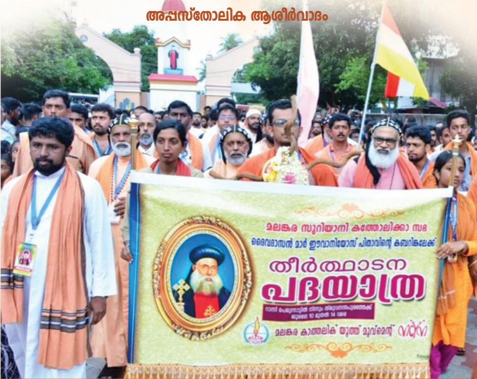
തീർത്ഥാടകർ ജൂലൈ 1-ാം തീയതി മുതൽ നോമ്പിന്റെ അരുപിയിൽ വ്രതനിഷ്ഠയോടെ മണ്ണുമാംസാദികൾ വർജ്ജിച്ച് ആത്മീയമായി ഒരുങ്ങണമെന്ന് ഓർമ്മിപ്പിക്കുന്നു.