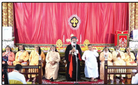
St John's Cathedral, Tiruvalla