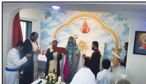
Bethany Convent, Nashik