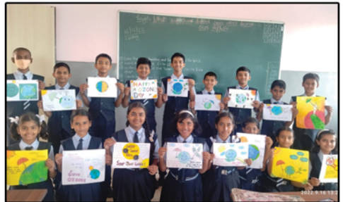
Ozone Day Celebration, Nashik School