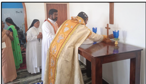
Mission Chapel, Denkanikottai