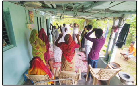
Pastors Training Programme, Paderu Mission