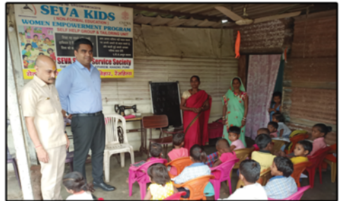
Joyalukas Team Visit, Sarvatravihar