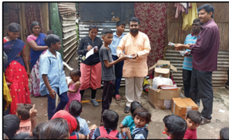
Vidhya Jyothi Programme, Sangvi-Pune