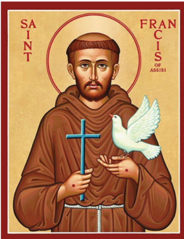
Feast of St Francis of Assisi (October 04)