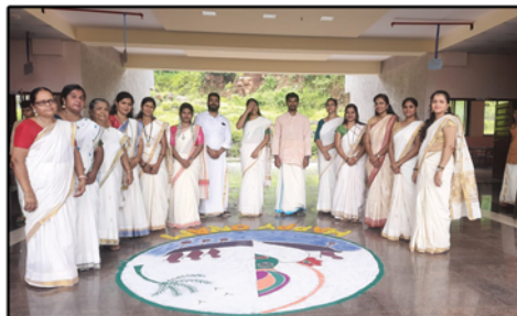
Onam Celebration, Khopoli School