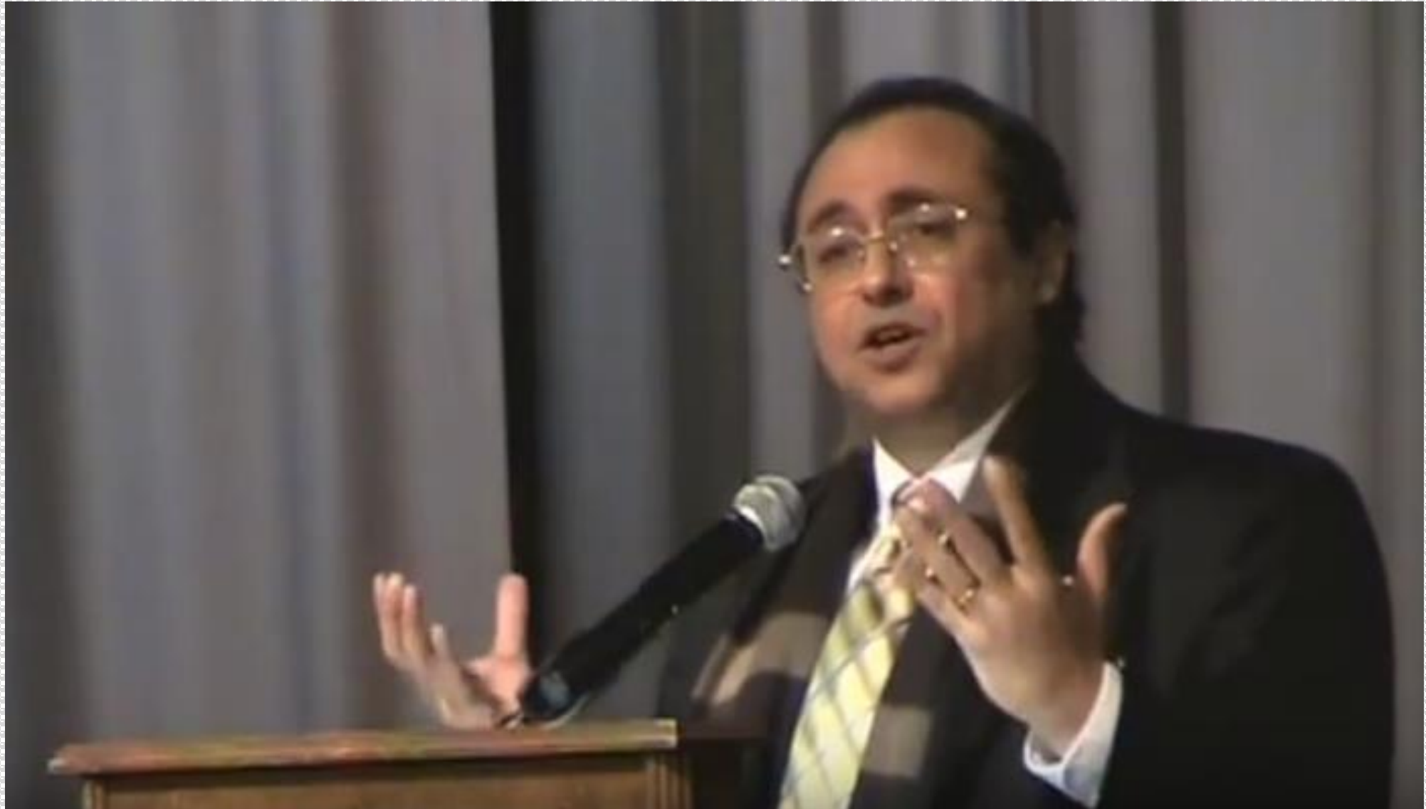
“Inside Jihad” Dr. Twafik Hamid