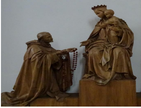
புனித டொமினிக் செபமாலை பெற்றுக்கொள்ளல்

இந்நிகழ்வுகளை சித்தரிக்கின்ற பல்வேறு விதமான ஓவியங்களும் கலை வடிவங்களும் திருச்சபைகளில் இன்றும் அதிகமாக காணக்கிடைக்கின்றன.