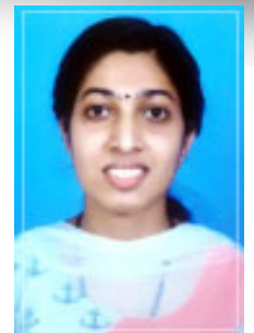
അനുഷ എൽദോ ബത്തേരി ഭദ്രാസനം

ഒരു കഥയോടുകൂടി നമുക്ക് തുടങ്ങാം. "Lost with a forest ". കാട്ടിലകപ്പെട്ടുപോയ അപ്പന്റെയും മകന്റെയും കഥ. ഒരിക്കൽ രണ്ടുപേരും കുടി കാട്ടിലേക്കു യാത്ര പുറപ്പെട്ടു. പച്ചയും മഞ്ഞയും ചുമപ്പും പൂക്കൾ വിരിച്ച മരങ്ങളും ഇണപിണഞ്ഞു കിടക്കുന്ന കാട്ടുവള്ളികളും മിനുസമുള്ള കല്ലുകളിൽ തട്ടിത്തരിച്ചു വരുന്ന കാട്ടാറും ഒക്കെ കടന്ന് അവർ കുറേ ദൂരം പോയി. അപ്പൻ സ്ഥിരമായി പോയിരുന്ന വഴിതെറ്റിയത് അപ്പോൾ മാത്രമാണ് അപ്പൻ അറിഞ്ഞത്. അപ്പൻ മകന്റെ കൈയിൽ മുറുകെ പിടിച്ചു.