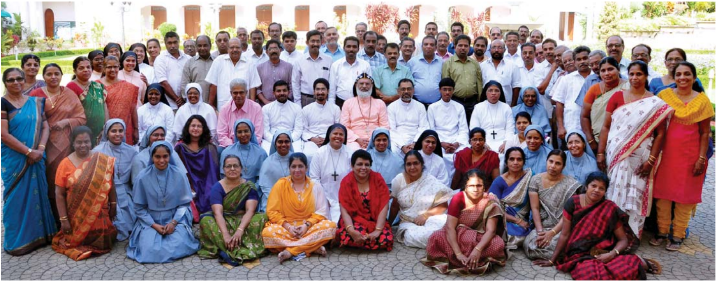
സഭാതല സുവിശേഷസംഘത്തിന്റെ നാലാം ബാച്ച് പട്ടത്ത് കാതോലിക്കേറ്റിൽ പരിശീലനത്തിൽ