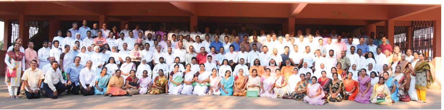
മലങ്കരസുറിയാനി കത്തോലിക്കാ സഭയിലെ കൈവയ്പ്പ് ലഭിച്ച സുവിശേഷ സംഘാംഗങ്ങൾ സുവിശേഷസംഘ സംഗമത്തിന് പട്ടത്ത് കാതോലിക്കേറ്റ് ഒന്നിച്ചുകൂടിയപ്പോൾ

ഇൻഡ്യയിലെ നമ്മുടെ എല്ലാ രൂപതകളിൽ നിന്നും, സുവിശേഷം ജീവിക്കുവാനും സുവിശേഷശുശ്രൂഷ ചെയ്യുവാനും, പ്രതിജ്ഞ ചെയ്ത, കൈവയ്പ്പ് വഴി നിരോധനം സ്വീകരിച്ച സുവിശേഷസംഘാംഗങ്ങളുടെ, സഭയുടെ ആസ്ഥാന കേന്ദ്രമായ കാതോലിക്കേറ്റ് സെന്ററിലെ ഈ കുടിവരവ്, സംഘാംഗങ്ങളിലും സുവിശേഷസംഘ ശുശ്രൂഷയിലും വേലിയ ചലനം സൃഷ്ടിച്ചു. വിവിധസ്ഥലങ്ങളിൽ നിന്നുള്ളവർ ഒന്നിച്ചുള്ള താമസം, പങ്കുവയ്ക്കൽ, വന്ദ്യപീതാക്കന്മാരുടെ സാനിദ്ധ്യം, പ്രബോധനങ്ങൾ, പ്രോത്സാഹനങ്ങൾ, പ്രാർത്ഥനകൾ എല്ലാം സംഘാംഗങ്ങൾക്ക് കുടുതൽ ഉണർവ് നൽകി. സുവിശേഷസംഘത്തിൽ അംഗമായിരിക്കുന്നതിന്റെ നന്മ തിരിച്ചറിയുന്നതിനും, സഭയുടെ ആസ്ഥാന കേന്ദ്രവുമായി ബന്ധപ്പെടുന്നതിനും, സഭയുടെ ഐക്യം ശക്തിപ്പെടുന്നതിനും, ദൈവദാസൻ മാർ ഇവാറിനിയോസ് തിരുമേനിയുടെ വിശുദ്ധിയും മാധ്യസ്ഥവുമു കൂടുതൽ അനുഭവിച്ചറിയുന്നതിനും ഈ കുടിവരവിലൂടെ സാധിച്ചു എന്ന സംഘാംഗങ്ങൾ സാക്ഷ്യപ്പെടുത്തി. പരമകാര്യണികനായ ദൈവത്തിന്റെ സ്നേഹത്തിനും പരിപാലനയ്ക്കും നന്ദി അർപ്പിക്കുന്നു.