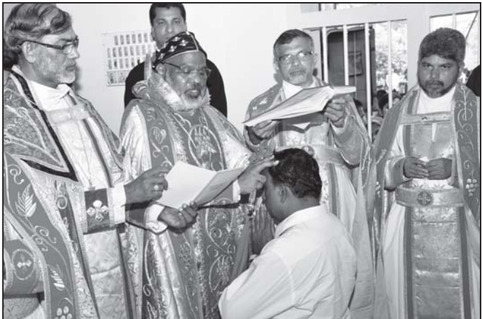
2015 ജൂലൈ 15 ന് പട്ടം സെന്റ് മേരീസ് കത്തീഡ്രലിൽ നടന്ന കയ്പയ്പ് ശുശ്രൂഷയിൽ നിന്ന്

പരിശുദ്ധാത്മാവിന്റെ വരങ്ങളും ദാനങ്ങളും ഉണ്ടായിരിക്കും. തൊട്ടിലിൽ കിടക്കുന്ന ഒരു കുഞ്ഞിനു പിതാവിന്റെ സ്വത്തിന് അവകാശമുണ്ട്. കാരണം അത് ജന്മാവകാശമാണ്. എന്നാൽ ആ കുട്ടി വളർന്ന് ആ സ്വത്ത് സ്വന്തം പേരിലാക്കി ഒരു അക്കൗണ്ട് തുടങ്ങി അതിൽ നിന്നും പൈസാ എടുക്കുമ്പോൾ മാത്രമാണ് ഫലത്തിൽ അത് യഥാർത്ഥ്യമാകുകയുള്ളൂ. ഇതുപോലെ മാമോദീസായിൽ എനിക്ക് ജന്മാവകാശമായി പരിശുദ്ധാത്മാവിനെ ലഭിച്ചു എന്നു പറയുന്നത് ശരിയാണ് എന്നാൽ ഫലത്തിൽ അത് എനിക്ക് അനുഭവമാകുന്നുണ്ടോ? യഥാർത്ഥ്യമാകുന്നുണ്ടോ? ഒരു കാനിനുള്ളിൽ ബാറ്ററി വച്ചിട്ടുണ്ട് എന്നത് സത്യമാണ് എന്നാൽ ബാറ്ററി പ്രവർത്തിക്കുന്നുണ്ടോ? ഹോൺ അടിക്കുന്നുണ്ടോ, ലൈറ്റ് കത്തുന്നുണ്ടോ? കാർ സ്റ്റാർട്ട് ആകുന്നുണ്ടോ? എന്നതാണ് ചോദ്യം. ബാറ്ററി പ്രവർത്തിക്കുന്നെങ്കിൽ മാത്രമേ അതുകൊണ്ട് ഉപയോഗമുള്ളൂ അർത്ഥമുള്ളൂ. ചുരുക്കത്തിൽ മാമോദീസായിൽ എനിക്ക് ജന്മാവകാശമായി പരിശുദ്ധാത്മാവിനെ ലഭിച്ചു എന്നു പറയുമ്പോൾ എനിൽ ഈ ആത്മാവ് പ്രവർത്തനക്ഷമമാണോ, ഫലം പുറപ്പെടുവിക്കുന്നുണ്ടോ, എന്റെ ശരീരത്തിന്റെയും മനസിന്റെയും വികാരങ്ങളുടെയും നിയന്ത്രണം ഈ അറുപിയൽ നയി