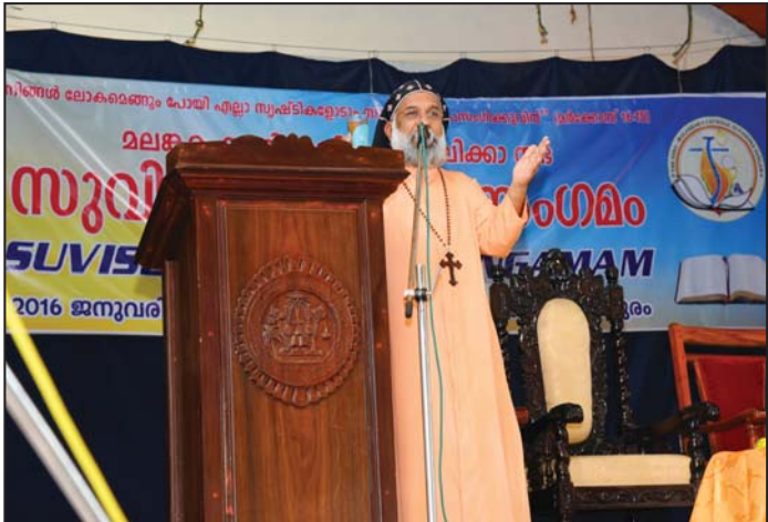
2016 ജനുവരി 29, 30 തീയതികളിൽ പട്ടം കാതോലിക്കേറ്റിൽ നടന്ന സുവിശേഷസംഘ സംഗമത്തിൽ മോറാൻ മാർ ബസേലിയോസ് ക്ലീമിസ് കാതോലിക്കാബാവ സംസാരിക്കുന്നു