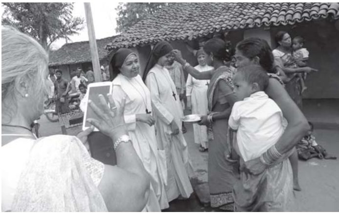
ഒറിസ്സാ മിഷനിൽ അരി നെറ്റിയിൽ വിതറി സിസ്റ്റേഴ്സിനെ ഭവനത്തിലേക്ക് സ്വീകരിക്കുന്നു