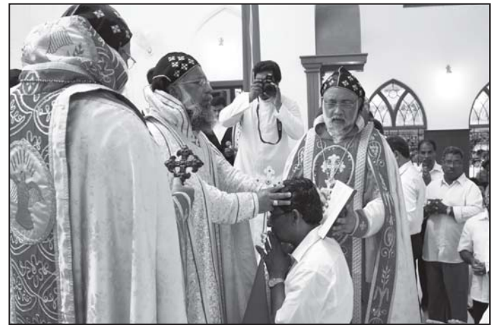
2012 സെപ്റ്റംബർ 21 ന് പത്തനംതിട്ടയിൽ നടന്ന കയ്പയ്പ് ശുശ്രൂഷ

കത്തോലിക്കരായ നാം എല്ലാവരും കൂഞ്ഞുപ്രായത്തിലെ മാമോദീസാ എന്ന കുറ്റാശയിലൂടെ വീണ്ടും ജനിച്ചവരും പരി