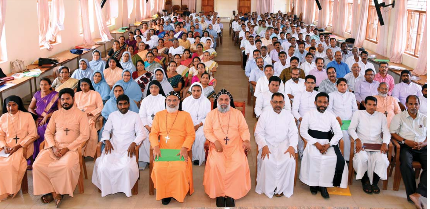
സുവിശേഷസംഘ സംഗമവേദിയിൽ സുവിശേഷസംഘാംഗങ്ങൾ ബസേലിയോസ് ക്ലീമിസ് ബാവ തിരുമേനിയോടും മെത്രാന്മാരോടുംചേർന്ന്