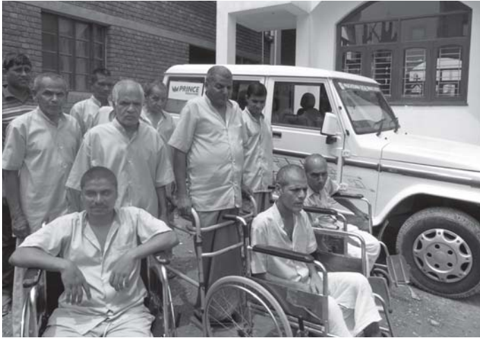
ഗുഡ്ഗവൺ - ഡൽഹി രൂപതയുടെ സാമൂഹ്യക്ഷേമ വകുപ്പായ പ്രചോദനയുടെ ആഭിമുഖ്യത്തിൽ നടത്തുന്ന ശുശ്രൂഷാകേന്ദ്രം

1 കോരി. 3:13,14 “ഓരോരുത്തരുടെയും പണി പരസ്യമാകും. കർത്താവിന്റെ ദിനത്തിൽ അതു വിളംബരം ചെയ്യും അഗ്നിയിൽ അതു വെളിവാക്കപ്പെടും. ഓരോരുത്തരുടെയും പണി ഏതു തരത്തിലുള്ളതെന്ന് അഗ്നി തെളിയിക്കുകയും ചെയ്യും. ആരുടെ പണി നിലനിൽക്കുന്നുവോ അവർ സമ്മാനിതന്മാരും.” അവസാന നാളിൽ ലഭിക്കുന്ന സമ്മാനത്തിനുവേണ്ടി നാം പ്രയാശിക്കുന്നുണ്ടെങ്കിൽ ഇപ്പോൾ നാം ജീവിതത്തിലെ സഹനമാകുന്ന അഗ്നിയുലൂടെ ശോധന ചെയ്യപ്പെടുകതന്നെ വേണം.