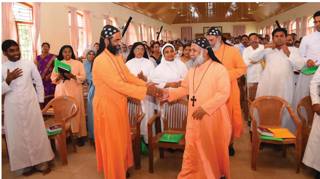
സുവിശേഷസംഘ സംഗമ വേദിയിലേക്ക് ബസേലിയോസ് ക്ലീമീസ് ബാവാ തിരുമേനി കടന്നുവരുന്നു