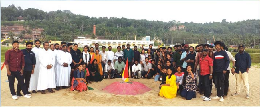
എം.സി.വൈ.എം. - അസ്സീസിയൻ സൗഹൃദതിരം