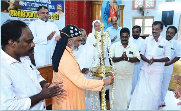
എം.സി.എ. - അലമായ, കർഷക, ഉദ്യോഗസ്ഥ സംഗമം അഭിവന്ദ്യ തോമസ് മാർ യൗസേബിയോസ് തിരുമേനി ഉദ്ഘാടനം ചെയ്യുന്നു