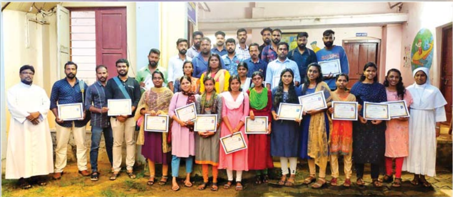
2022 ഡിസംബർ മാസം 2, 3 തീയതികളിൽ കൊടങ്ങാവിളയിൽ വച്ച് നടന്ന വിവാഹ ഒരുക്ക സെമിനാറിൽ പങ്കെടുത്തവർ