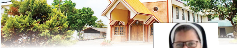
സി ജെസലിൻ ജോസഫ് MSST