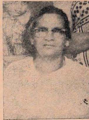
ജനനം : 1914-3-2 മരണം : 1987-3-7