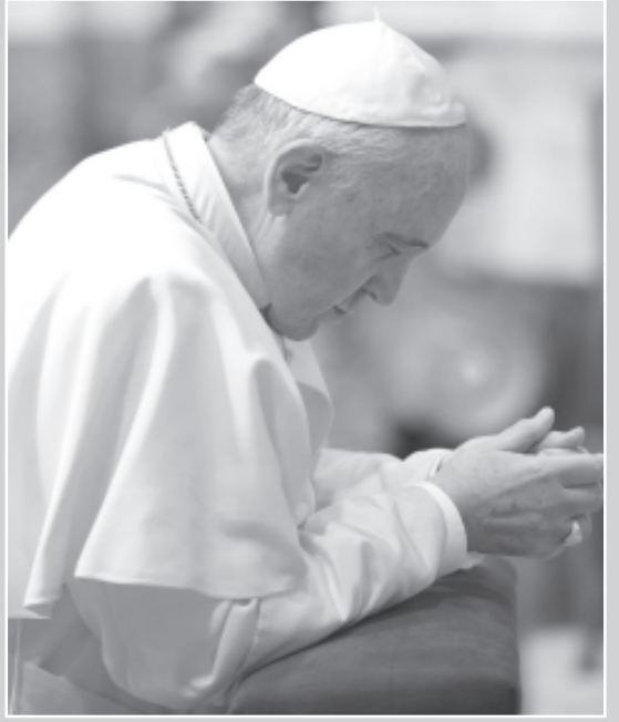
കാര്യം വർഷ പ്രാർത്ഥന

നിന്റെ കാര്യം കടാക്ഷമാണ് സഭയ്ക്കുവേണ്ടിയും മത്തായിയേയും സമ്പത്തിന്റെ അടിമത്തത്തിൽ നിന്നും, മഗ്ദലനമറിയത്തെ സൃഷ്ടവസ്തുക്കളിലുള്ള സന്തോഷത്തിൽ