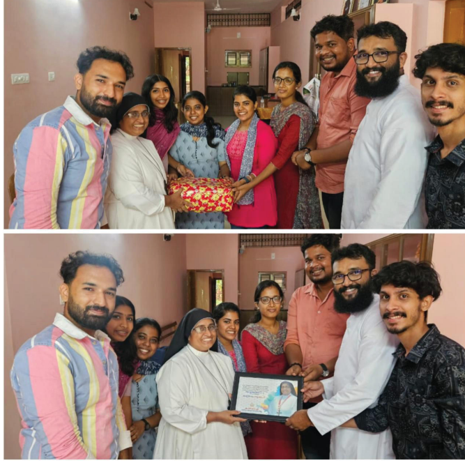
കഴിഞ്ഞ നാലു വർഷത്തെ സ്തുത്യർഹമായ സേവനത്തിലൂടെ യുവജന പ്രസ്ഥാനത്തിന് പുത്തൻ