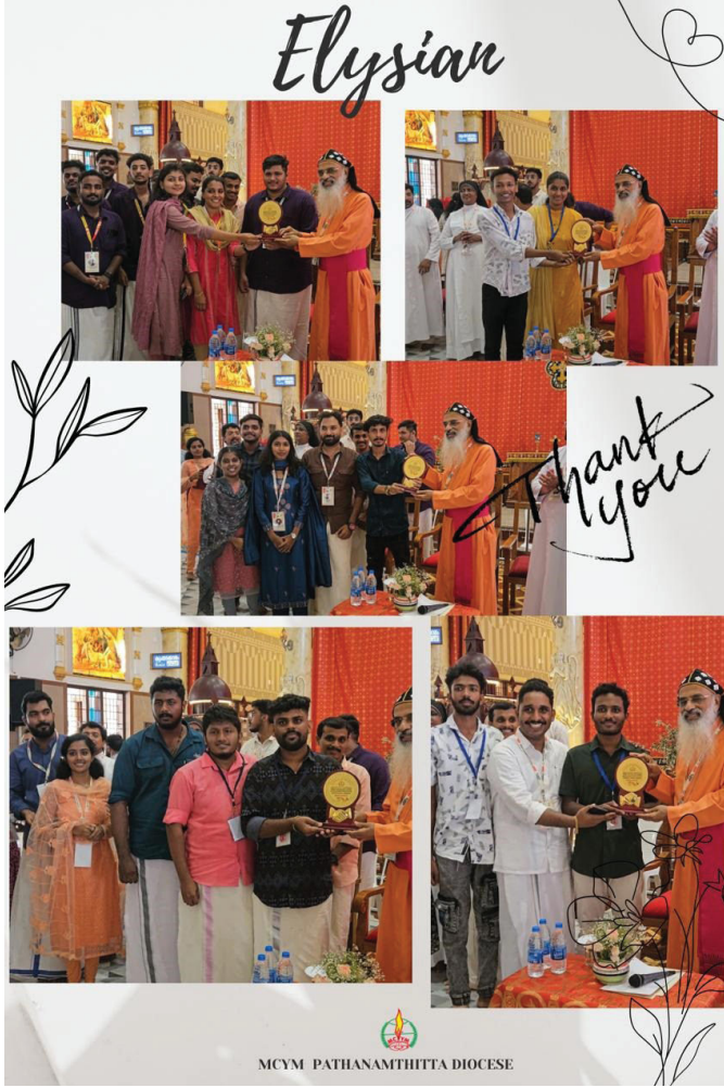
MCYM PATHANAMTHITTA DIOCESE