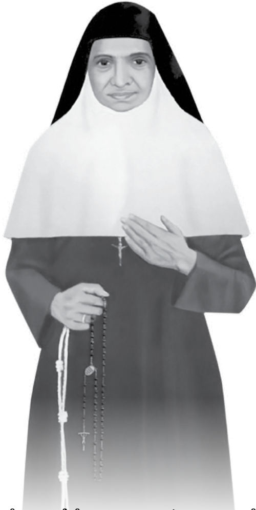
സ്റ്റിലററച്ച ജീവിതലക്ഷ്യം നേടാൻ 21-ാം വയസ്സിൽ കൊളേത്താമ്മ VSLC കരസ്ഥമാക്കി.