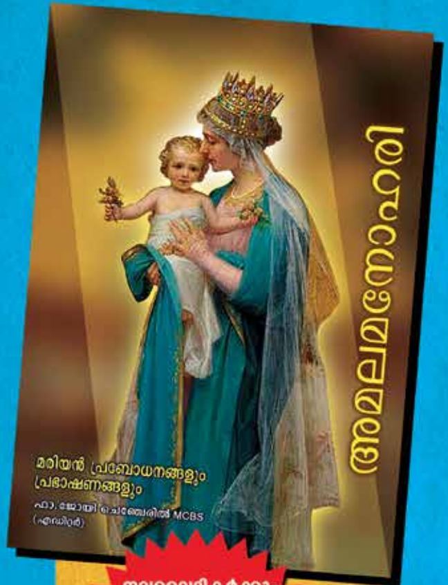
മരിയൻ പ്രബോധനങ്ങളും പ്രഭാഷണങ്ങളും ഫാ. ജോയി ചെമ്മേരിൽ MCBS (എഡിറ്റർ)

EMMAUS PUBLICATIONS Karunikan MCBS House Perumanoor P.O, Thevara, Kochi - 682015 Ph: 8281773551, 0484-2663933