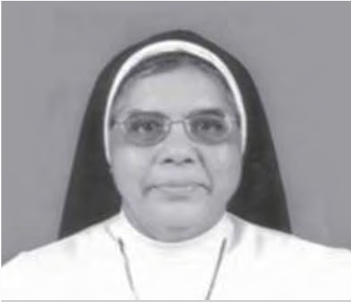
സിസ്റ്റർ സാൻക്ട് (കർമ്മലീത്ത സഭ)

അംഗങ്ങൾ : 6350 പ്രൊവിൻസുകൾ : 20 റീജിയൻ : 6 രാജ്യങ്ങൾ : ഇന്ത്യ, ആഫ്രിക്ക, ജർമ്മനി, അമേരിക്ക ശുശ്രൂഷാരംഗങ്ങൾ : വിദ്യാഭ്യാസം, വിശ്വാസതുപീകരണം, ആതുരശുശ്രൂഷ, അഗതിശുശ്രൂഷ, സാമൂഹ്യസേവനം