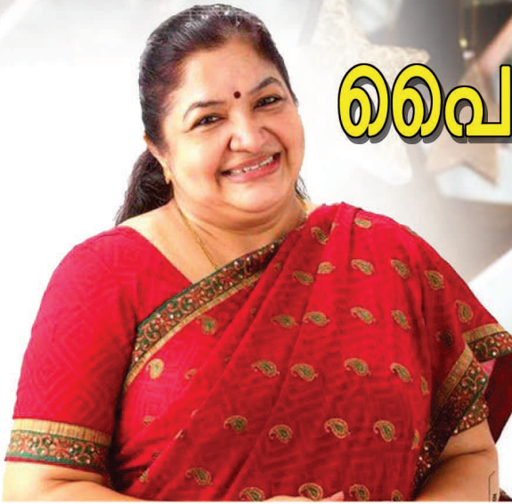
കെ. എസ്. ചിത്ര

മലയാളികൾക്ക് എല്ലാ ആഘോഷങ്ങളുമായി ബന്ധപ്പെട്ടും മനസ്സിൽ പതിഞ്ഞു കിടക്കുന്ന ചില ഈണങ്ങളുണ്ട്. അതു മതപരമോ സാമൂഹികമോ രാഷ്ട്രീയമോ എന്തുമായിക്കൊള്ളട്ടെ, ചില പാട്ടുകൾ നമ്മെ വളരെപ്പെട്ടെന്ന് ചില ഓർമ്മകളിലേക്ക് ഉണർത്തും. ചില വേദനകൾ മറക്കാൻ അതു നമ്മെ സഹായിക്കും. ചിലപ്പോൾ നമ്മെ വല്ലാതെ ആവേശം കൊള്ളിക്കും. ചിലപ്പോൾ കരയിക്കും. മനസ്സിനെ ശുദ്ധീകരിക്കാൻ അതു നല്ലതാണ്.